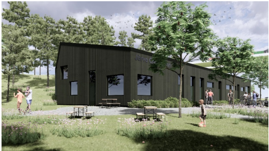
Vy över servicebyggnadens framsida. Illustration: Cedervall arkitekter.