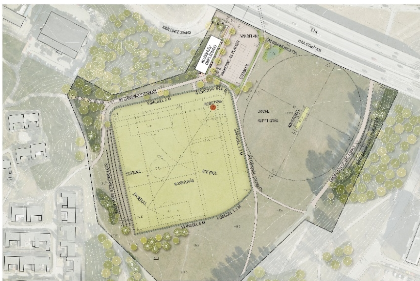
Illustrationsplan över föreslagen idrottsanläggning i samrådsförslaget. Alternativ ett innebär en ny multifunktionell bollplan och en ny cricketplan. Illustration: LAND Arkitektur.

Detaljplanen reglerar idrottsändamål och inriktningen för samrådsförslaget är att anlägga antingen en multifunktionell bollplan för fotboll, softball och baseboll samt en cricketplan (alternativ ett) eller två cricketplaner (alternativ två). En servicebyggnad och parkeringsplatser för bil och cykel föreslås i anslutning till bollplanerna. Angöring sker från Krällingegränd. Även nya gång- och cykelvägar föreslås inom planområdet.