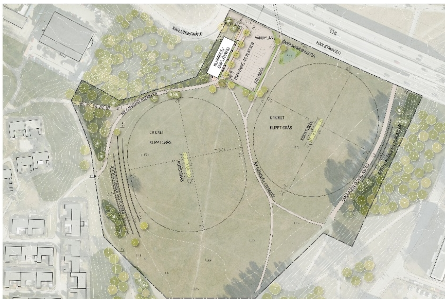
Illustrationsplan över föreslagen idrottsanläggning i samrådsförslaget. Alternativ två innebär två nya cricketplaner. Illustration: LAND Arkitektur.

Idrottsanläggningen ska anpassas till Spångadalens kulturhistoriska värden och inordna sig i natur- och kulturmiljön. Dalgångens öppenhet, vegetation och möjligheten att röra sig fritt genom området är värden som ska värnas. Nya gångbanor föreslås till och genom området. En utgångspunkt för gestaltningen är anpassning till terrängen. Tillkommande växtlighet föreslås anpassas till områdets karaktär.