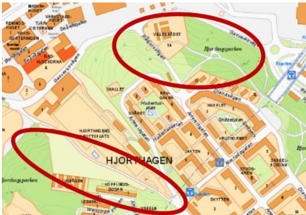
Figur 1. Utredningsförslagens (olämpliga) förslag på skogsområden att bebygga i Hjorthagsparken.

På stadsbyggnadsnämndens möte 9/12 2021 skall nämnden fatta beslut om ytterligare exploatering i Stockholm. På bordet ligger bland annat ett utredningsförslag om att exploatera och permanent bebygga två stycken skogsområden i Hjorthagsparken i Hjorthagen (Östermalm) med upp till 400 lägenheter. Ärendenumret är §013: 2021-14449. Se nedan.