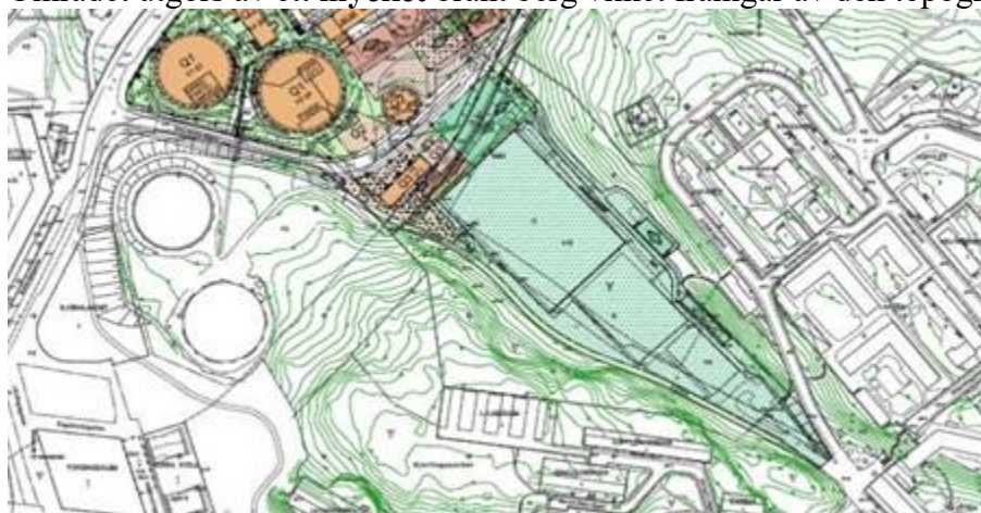
Karta 3. Planförslag för Gäddet Västtra, 2015-03-10

Området utgörs av ett mycket brant berg vilket framgår av den topografiska kartbilden nedan.