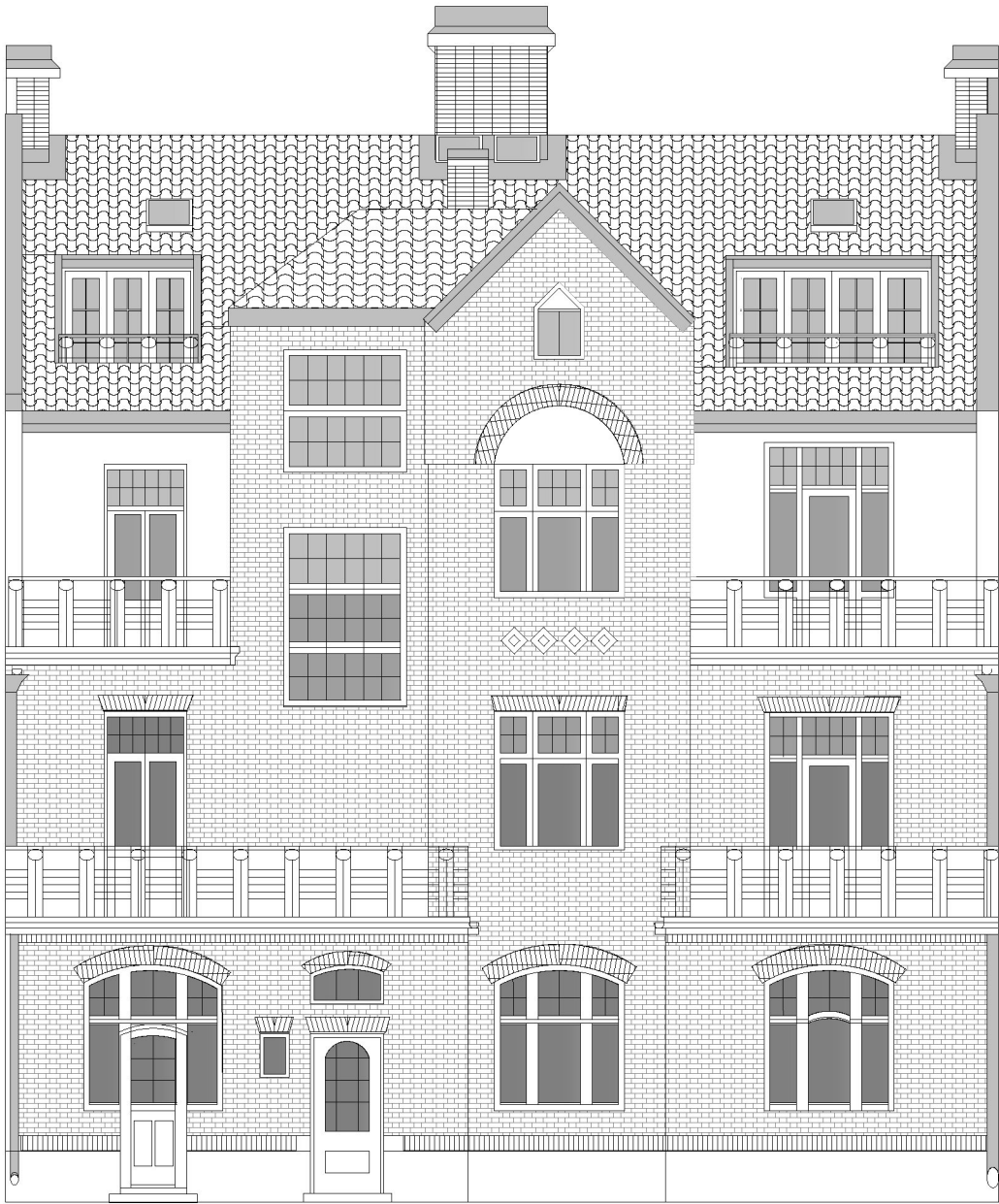
Fasad B 1:100