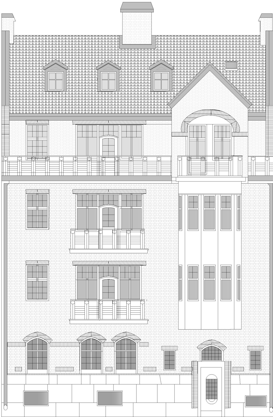
Fasad A 1:100