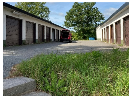
2- Garage till radhusbebyggelse.