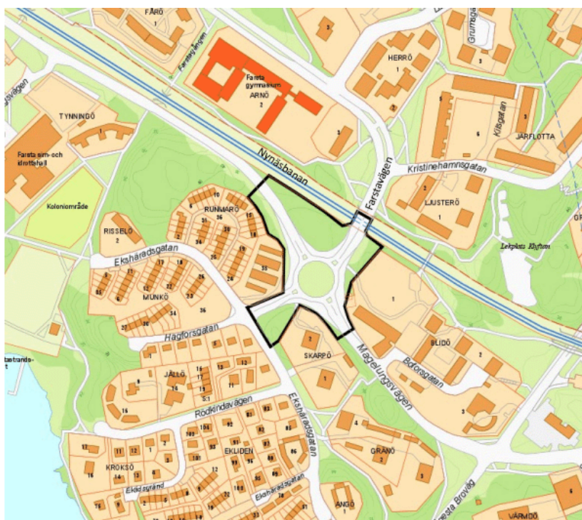
Planområdets avgränsning intill befintlig bebyggelse, markerat med svart linje.

Planområdet består av en del av fastigheten Farsta 2:1 och omfattar cirka två hektar mellan Farstavägen, Magelungsvägen samt Hagforsgatan i Farsta. I norr och öster gränsar området till Nynäsbanan, i väster mot radhus- och villabebyggelse samt i söder mot högre flerbostadshus.