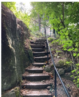
5- Trappan i naturmark i norr.