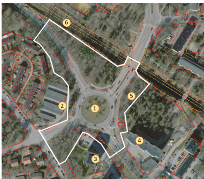
Cirkulationsplatsen – Farstarondellen.

Norr om planområdet, på andra sidan Nynäsbanan, ligger Farsta grundskola och Farsta Centrum. En bit längre västerut längs Magelungsvägen ligger Farsta Gård och Farsta IP.