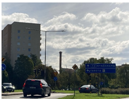
1- Farstarondellen, vy från norr.