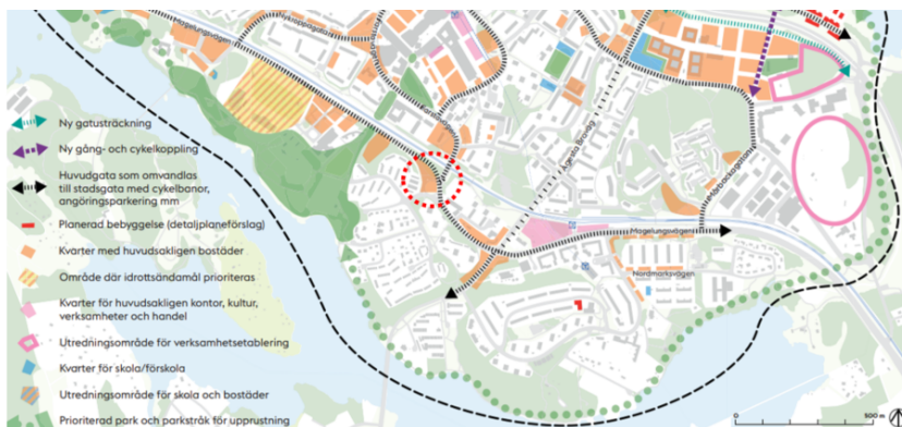
Södra delen av programområdet ur godkänd handling från 2016 med planområdet grovt markerat med rödprickad linje.

Programmet öppnar bland annat upp för stadsutveckling utmed Magelungsvägen och Farstavägen, som ska omvandlas till urbana stråk på Farstas villkor. Platsen är utpekad för komplettering med bostäder samt ny trafiklösning. Cirkulationsplatsen där Farstavägen möter Magelungsvägen tar stor yta. Den föreslås att ersättas med två trevägskorsningar så att plats frigörs för bostäder.