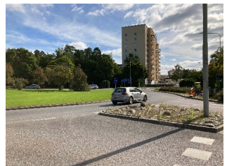
4- 11 våningar skivhus.