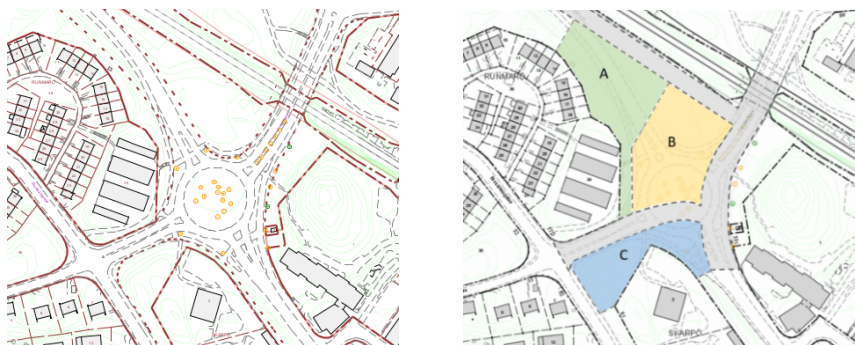
Befintlig cirkulationsplats och illustration över föreslagen kvartersstruktur.

Planförslaget innebär att omkring 300 nya bostäder föreslås inom området. Den nya bebyggelsen ska utformas som en sammanhållen årsring i en enhetlig skala där byggnaderna kantar gatorna. De bidrar även till att stärka gaturummet och formar en tydlig entré till Farsta centrum. Verksamhetslokaler och en förskola om fyra avdelningar med kvalitativa friytor ska integreras i bottenvåningarna. Parkering för bil ska tillskapas i enlighet med stadens riktlinjer för gröna parkeringstal, och inrymmas i underjordsgarage på kvartersmark.