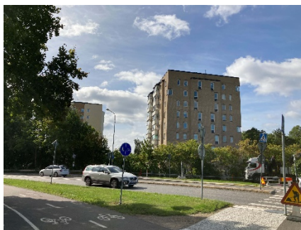
3- 10 våningar punkthus.