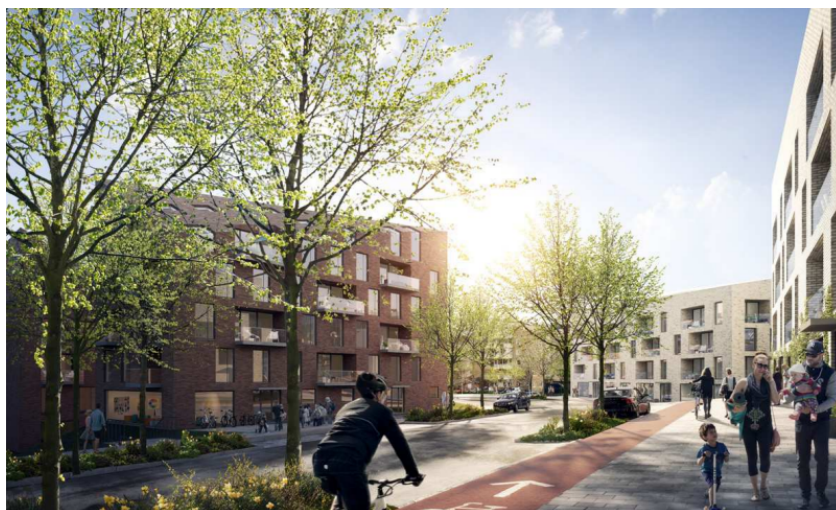
Vy över ny bebyggelse längs Farstavägen. (Nyréns/Tomorrow)

Bostadsgårdar och allmänna platser ska utformas med en tydlig grön karaktär, tillhandahålla ekosystemtjänster samt utvärderas med grönytefaktor. Stort fokus ges till gåendes upplevelse.