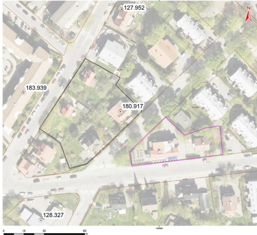
Figur 2. Översiktskarta som visar närliggande identifierade objekt i EBH-stödet. Källa Lantmäteriet och Länsstyrelsen.

på halter av kobolt över KM men under riktvärdet för mindre känslig markanvändning (MKM). Kobolt är dock naturligt förhöjt i lera i delar av Mälardalen vilket gör att den analyserade halten kan vara naturlig. Uttagna grundvattenprov visar generellt på låga halter. Ofiltrerade prov visar på förhöjda halt avseende bly, dock inte filtrerat prov. Vid bedömning av halter i grundvatten ska jämförelse göras med filtrerat prov.