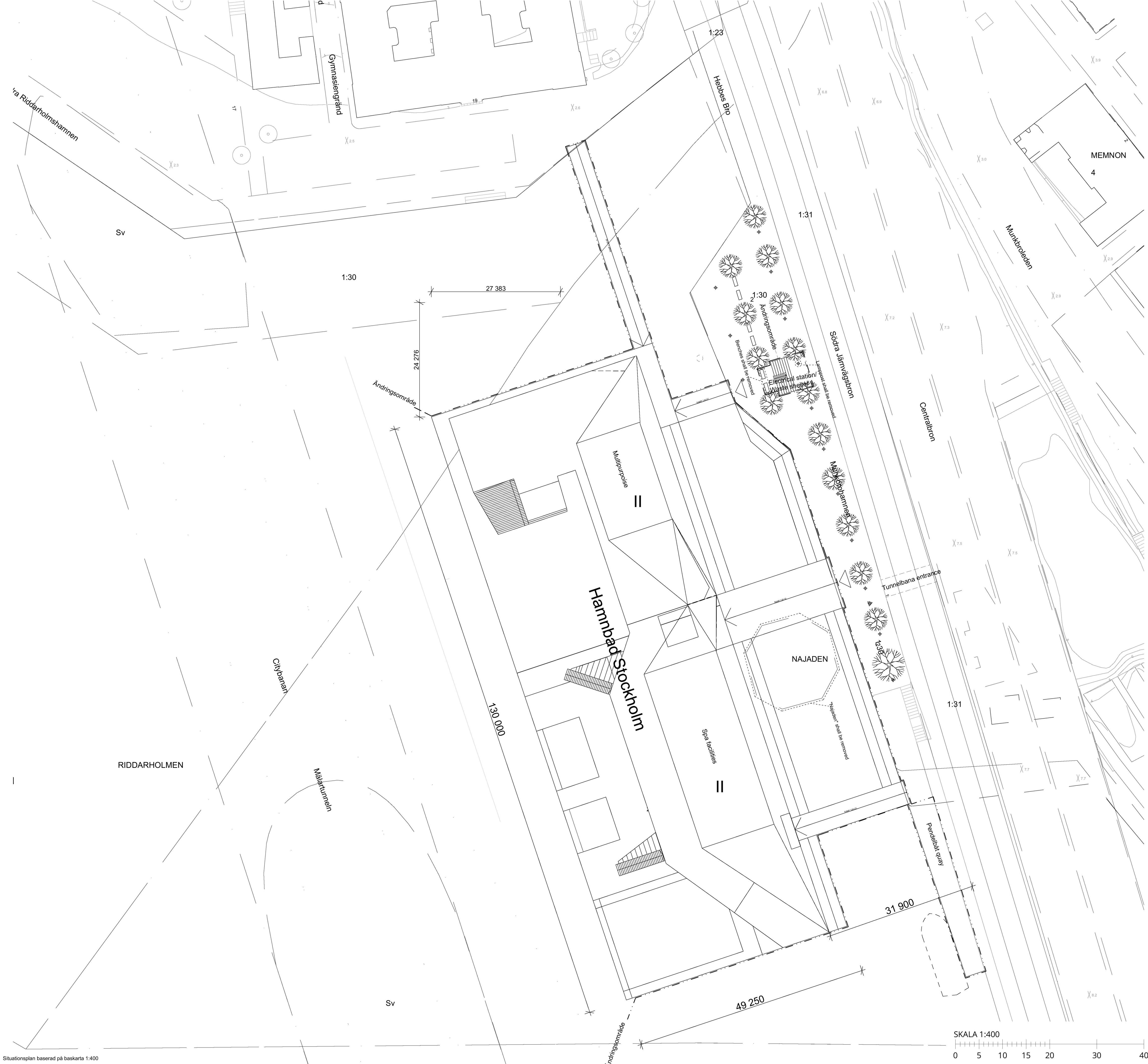
Situationsplan baserad på baskarta 1:400

Inkom till Stockholms stadsbyggnadskontor - 2021-05-17, Dnr 2020-11119