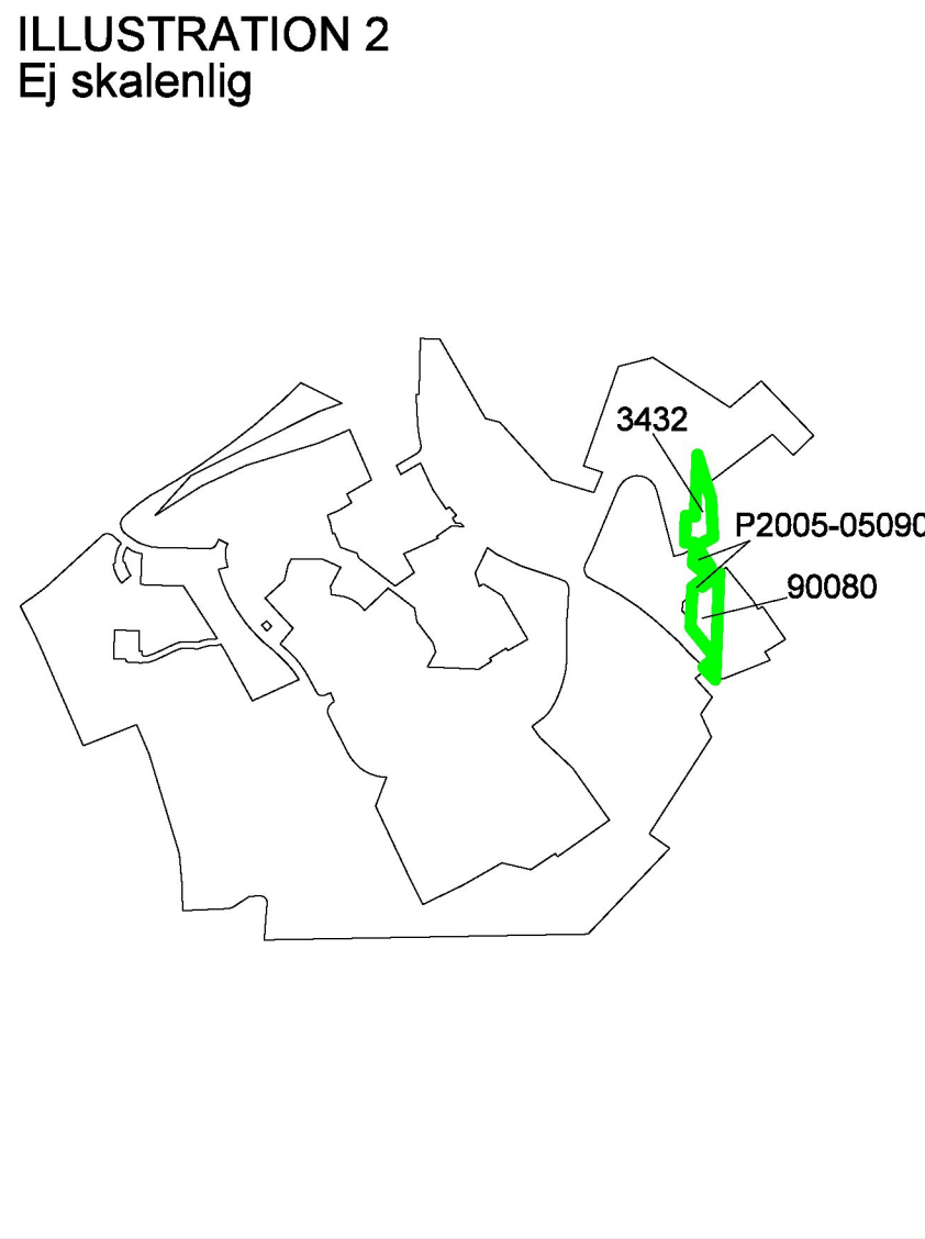
Illustration 2 visar berörda detaljplaner. Ändring genom tillägg görs inom grönmarkerade områden.