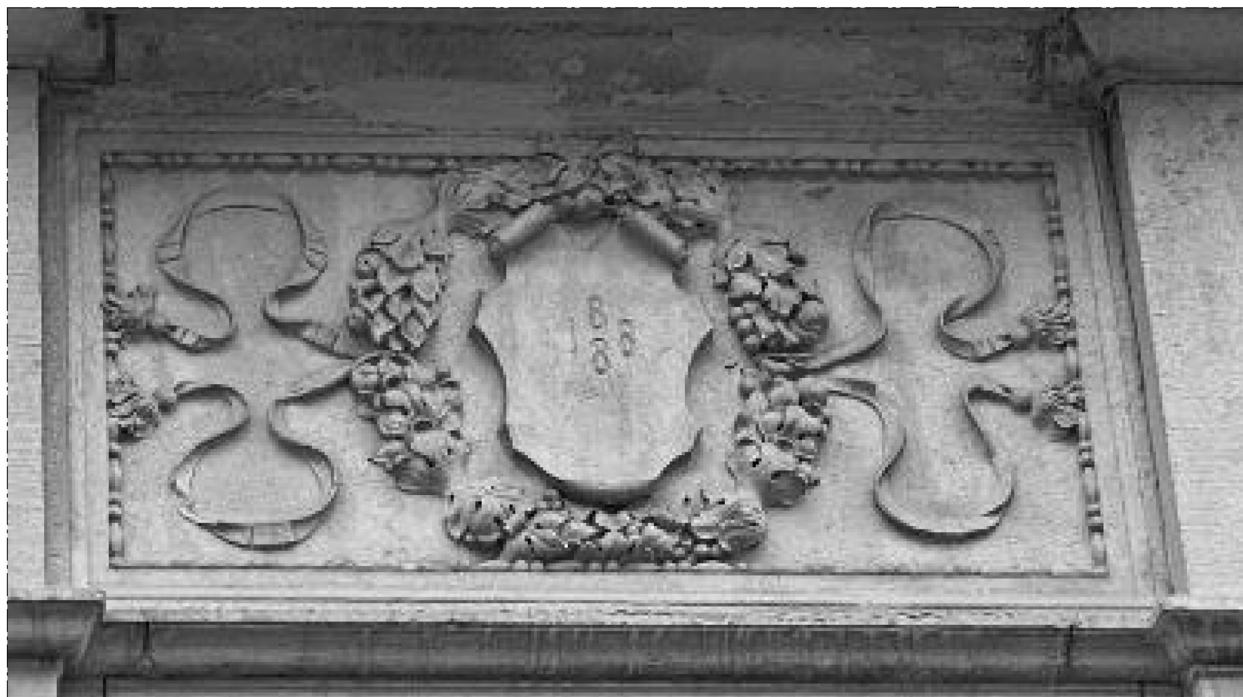
OM16/OM17-FOTO REFERENS KARTUSCH - STYRMANSGATAN 7