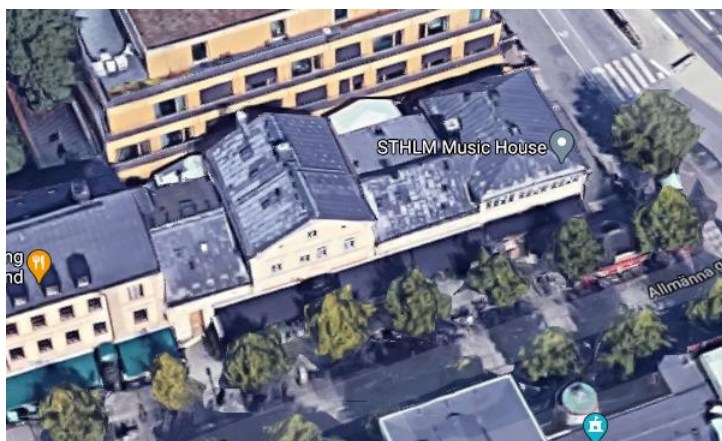
Vy från söder

Försörjning med kyla kan anordnas med egen kylmaskin eller försörjning från kylmaskincentralen i Konsthallen 2.