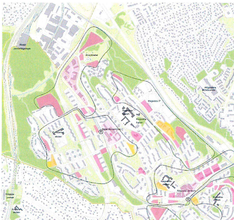
Bild: Utsnitt ur översiktsillustration Fokus Hagsätra Rågsved. Rosa ytor visar potential för bostäder, arbetsplatser och service. Gula ytor visar platser för utökade eller nya skolor och förskolor.

Även i översiktsplanen är sambandet mellan Hagsätraskogen och Rågsveds naturreservat utpekade som ett viktigt regionalt ekologiskt samband. Sambandet förstärker kopplingen mellan Bornsjökilen och Hanvedenkilen. Att låta området ingå i naturreservatet ligger i linje med översiktsplanens stadsbyggnadsmål om