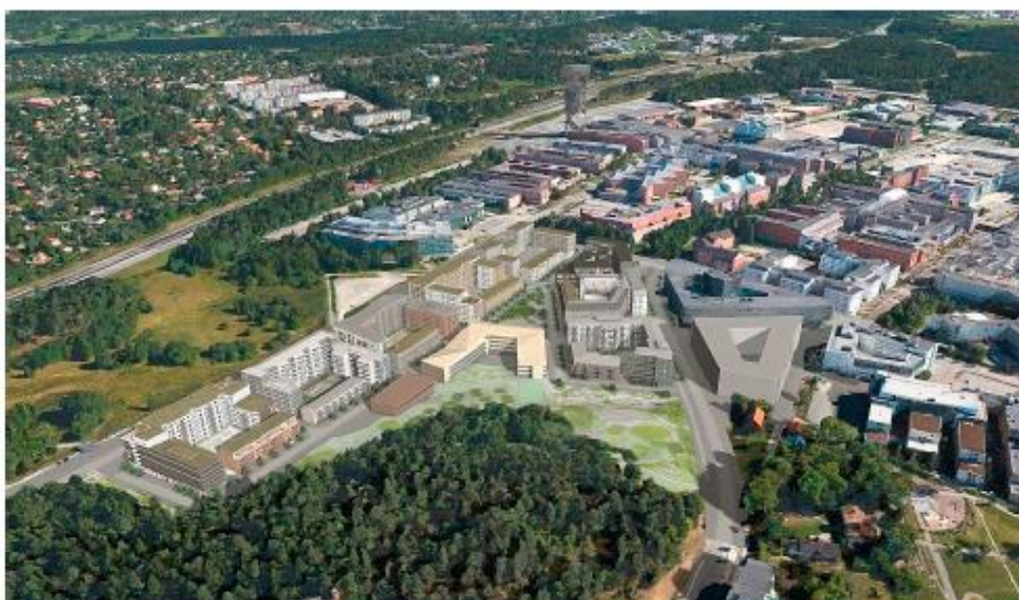
Vy från väst över planområdet. NOD-huset till höger i bild.

Kista Ängs föreslagna stadsbild utgår ifrån platsens skålliknande form, där omgivande gator och natur ligger högre än områdets mitt. Föreslagen bebyggelsestruktur bygger på omgivande gaturums riktningar, så att kopplingar och flöden till och inom området samt till omgivande kvarter och friytor stärks. Bebyggelsen, i form av tydligt avgränsade kvarter, placeras utmed Kista Alléväg, Borgarfjordsgatan och Torshamnsgatan. Kista Äng bygger på ett stadsbyggnadskoncept som har tre vägledande delar: kilen, stadsbilden och gatustrukturen. Tillsammans bildar de en grund och en gemensam bild för stadsbyggandet i Kista Äng.