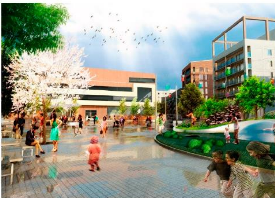
Vy över det centrala torget. Illustration: Landskapslaget.

Området föreslås inrymma ca 1600 bostäder, varav ca 950 bostadsrätter, ca 400 hyresrätter och ca 240 lägenheter för omkring 400 studenter i en blandning av enskilda studentlägenheter samt kompisboenden. Totalt tolv servicelägenheter och två gruppbo-städer med tolv respektive sex lägenheter planeras. Bostadsbebyggelsen i Kista Äng får höjder som i huvudsak varierar mellan sex och åtta våningar mot de yttre gatorna och gränder där bebyggelsen får en stadskaraktär. Mot stadsradhusgatorna uppförs en mindre del av bebyggelsen i en lägre skala (mellan tre och fyra våningar) i form av byggnader med ett uttryck av stadsradhus.