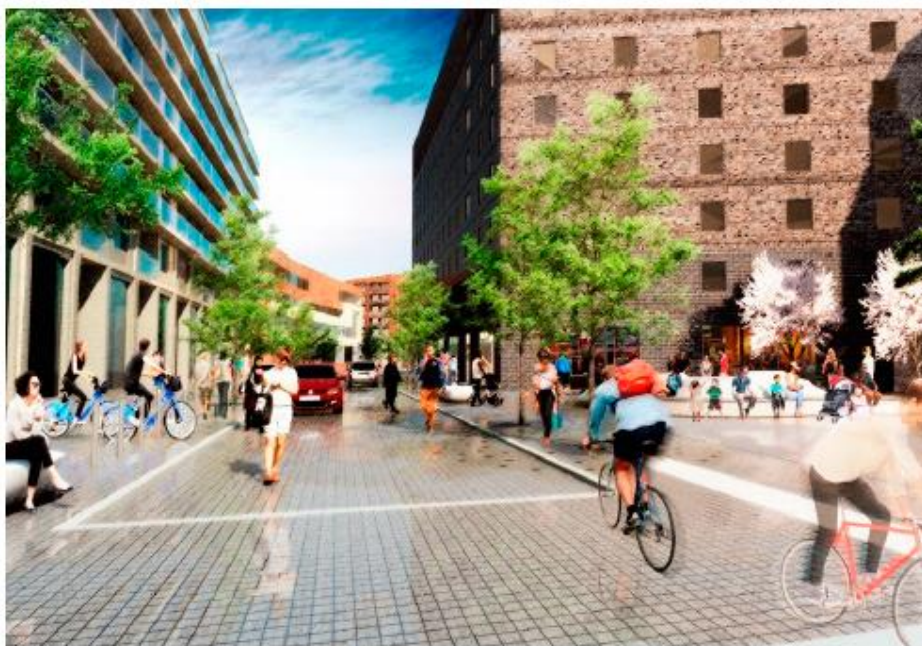
Vy över den urbana axeln och Entrétorget. Illustration: Landskapslaget.

Gatorna i Kista Äng ansluter till, kompletterar och förtätar det befintliga gatunätet i området. Gatorna är en del av stadsrummet och ramar in kvarteren, torgen och stadsparken för att skapa en tydlig avgränsning mellan privat och offentligt. Det övergripande målet är att stärka den mänskliga skalan med en mer finmaskig gatustruktur där alla trafikslag samsas och där gående och cyklister kan röra sig tryggt. Den urbana axeln är områdets primära stråk, kantat av verksamheter och service. Det ingår i ett större sammanhängande stråk som har en stor potential att bli ett av Kistas viktiga och levande gångstråk från Kista tunnelbanestation till Torshamnsgatan. Entrétorget vid korsningen Kista Alléväg/urbana axeln blir den naturliga entrén till Kista Äng från Kista tunnelbanestation och centrum.