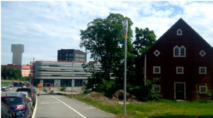
Kista Gård utmed Kista Alléväg, vy mot öster. NOD-kvarteret och hotellet Victoria Tower i bakgrunden. Magasinsbyggnaden som tillhört Kista Äng, tidigare i bild, finns inte längre kvar.