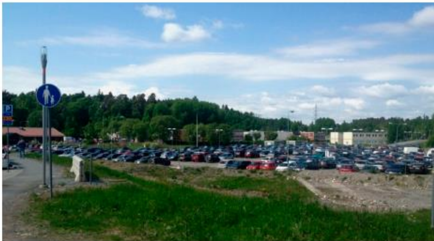
Idag kännetecknas planområdet av en stor markparkering. Vy från korsning Borgarfjordsgatan och Kista Alléväg.

I områdets östra del finns ett mindre lövskogsområde och naturmark som ingår i ett större skogsparti. Ekologiska värden finns främst i områdets västra del som i huvudsak består av barrskog och större inslag av lövskog. Planområdet utgörs huvudsakligen av lermark som överlagrar friktionsjord och därunder berg. Marken inom planområdet klassificeras som högradonmark. Planerade byggnader ska därmed utföras radontäta. Kista Gård med parken söder om planområdet är en kultur-historiskt mycket värdefull miljö. Gården har anor från 1400-talet och bebyggelsen är blåmarkerad på Stadsmuseets kulturhistoriska klassificeringskarta.