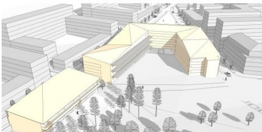
Skolbyggnaden placeras centralt i området och får en hästskoformad volym som följer gatornas riktning. Vy från väster. Illustration: Stadion Arkitekter.