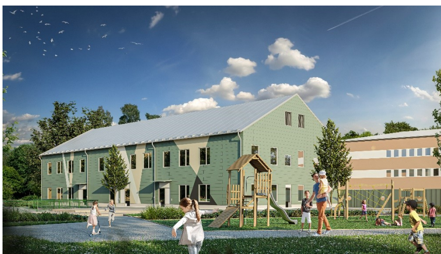
Perspektivbild som visar möjlig utformning av ny förskola norr om Kvickenstorpsskolan.

Norr om den befintliga skolan skapas möjlighet för en fristående förskola med upp till åtta avdelningar. Förskolans kapacitet ska dels möta ett behov som uppstår när fyra avdelningar flyttas från den befintliga skolbyggnaden och dels det behov som uppstår med tillkommande bostäder. Förskola ryms inom användningen S (skola). Det gör det möjligt att i framtiden använda byggnaden även för skolverksamhet om behovet av förskola minskar och skolan har behov av fler lokaler. Förskolan tillåts i planen ha två våningar. Byggnadens placering har tagit hänsyn till en flödesväg vid skyfall. Samrådsförslaget reglerar inte förskolans gestaltning. Detta avses göras till plangranskningen. Leveransväg till förskolan kan flyttas från dagens Kvickensvägen till nya Lingvägen.