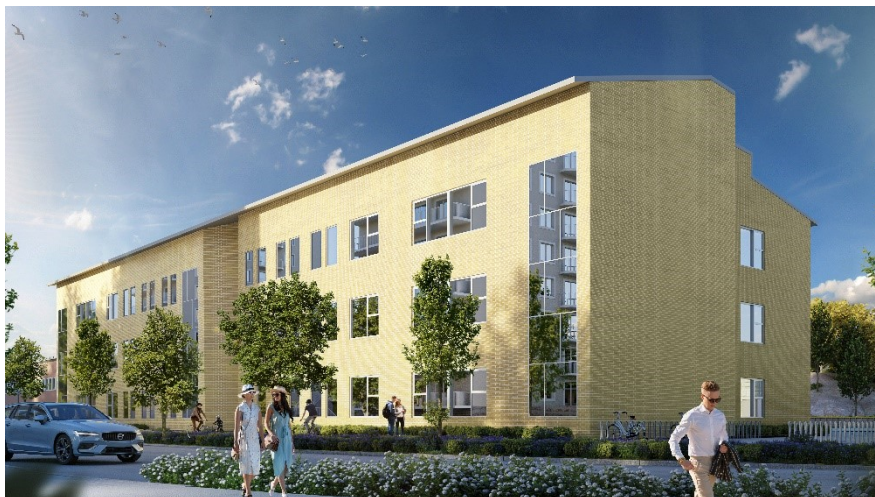
Perspektivbild som visar möjlig utformning av ny skolbyggnad tillhörande Kvickenstorpsskolan. Bild: PE Teknik & Arkitektur

Detaljplanen bekräftar Kvickenstorpsskolans befintliga byggnader samt ger dem möjlighet till viss utökning av byggrätten åt alla sidor, även i höjd. Därtill skapas byggrätt för en tillbyggnad i tre våningar placerad mot Lingvägens nya sträcka, samt två lägre byggnadsdelar mellan tillbyggnaden och den befintliga byggnaden respektive idrottsbyggnaden. Syftet med tillbyggnaden är att utöka skolans elevkapacitet, från dagens 650 till 1100 elever. Samrådsförslaget reglerar inte med några bestämmelser tillbyggnadens gestaltning. Detta avses göras till plangranskningen. Leveransväg till skolan kan flyttas från dagens Kvickensvägen till nya Lingvägen.