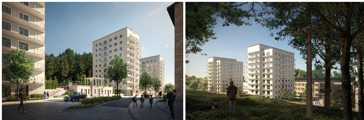
Perspektivbilder med vyer från Lingvägen mot norr (bild t.v.) respektive från naturmarken bakom punkthusen. Den nya skolbyggnaden skymtar till höger i båda bilderna. Bilderna visar möjlig utformning av bebyggelsen inom ramen för vad detaljplanen möjliggör.

Det projektspecifika parkeringstalet är 0,55 platser per lägenhet. Om byggaktören inför mobilitetstjänster kan parkeringstalet sänkas till som mest 0,41 platser per lägenhet. Angöring föreslås ske i angöringsfickor parallellt med körbanan, framför bostadsentréerna.