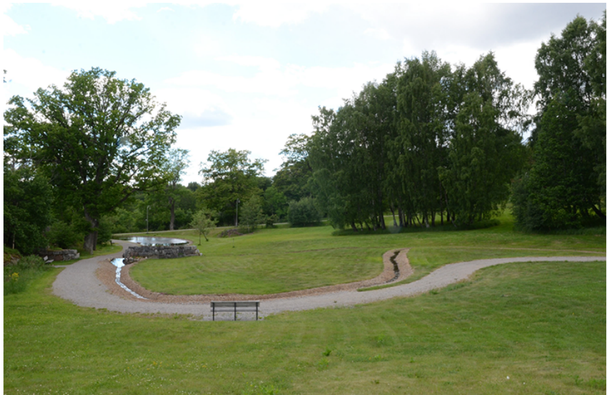
Föreslagen plats för byggnaden.