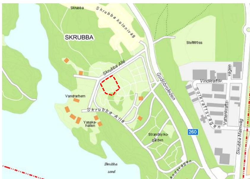
Aktuellt planområde (röd linje) inom Strandkyrkogården.