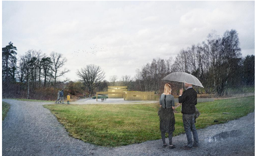
Dagsvy över föreslagen ceremonibyggnad (A-sidan arkitektkontor).

så vis finns förutsättningar för att människor får ta del av kulturella aktiviteter även i Strandkyrkogården samt tillgång till de rekreativa miljöerna vid begravningsplatsen.