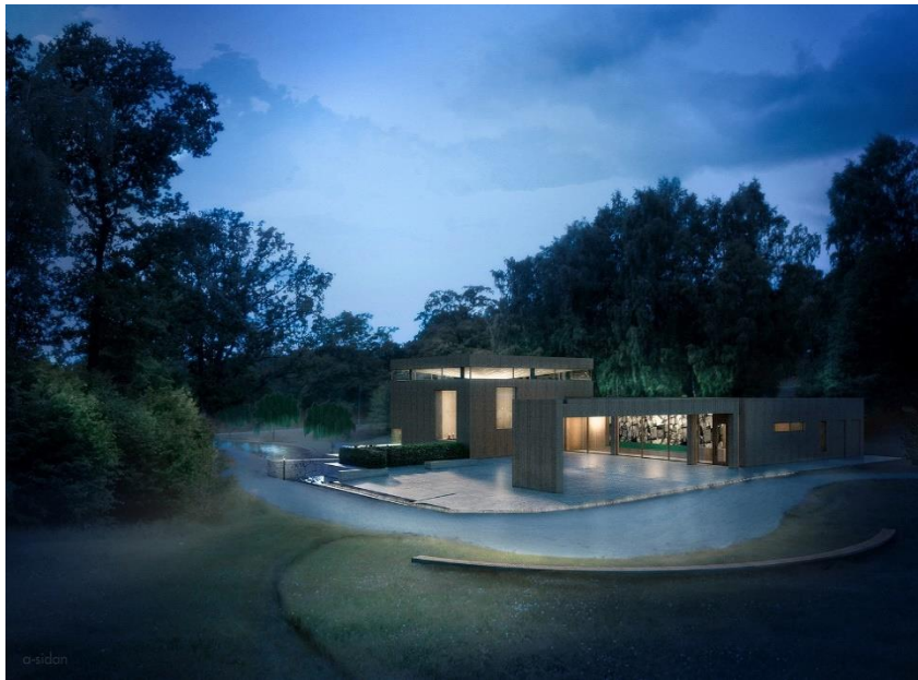
Kvällsvy över föreslagen ceremonibyggnad (A-sidan arkitektkontor).