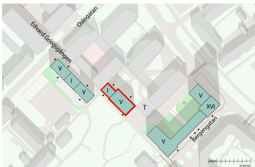
Illustrationsplan över södra delen av planområdet. Byggnaden som utgått ur detaljplanen är markerat i rött. Illustration: Bergkrantz Arkitektur

Efter granskningsskedet har flerbostadshuset norr om Edvard Griegsgången utgått från detaljplanen. Detaljplanens omfattning har av denna anledning minskat i antagandehandlingarna. Revideringen innebär att ca 25 bostäder, lokaler för centrumändamål samt förskola undantas från planen.