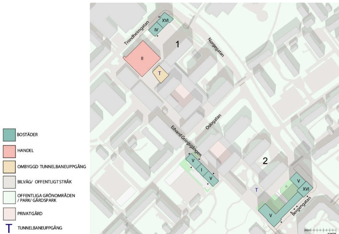
Illustrationsplan över planområdet. Bilden visar område 1, norra tunnelbaneuppgången samt område 2, södra tunnelbaneuppgången. Illustration: Bergkrantz Arkitektur

delvis ersätter den ett befintligt parkeringsgarage samt befintliga envåningsbyggnader som idag inrymmer lokaler för handel och föreningsverksamhet.