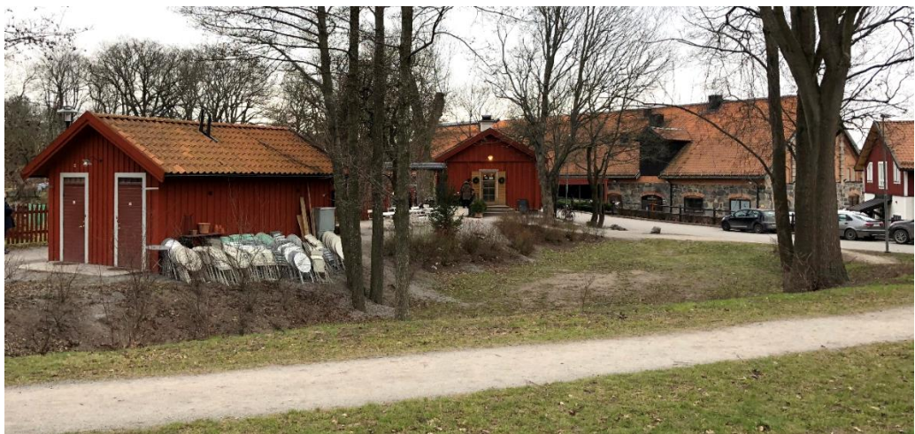
Enskedeparkens bageri och till höger syns Enskede ridstall.

Planområdet gränsar i söder till Enskede Gårdsväg och Enskede ridstall. I planområdets östra kant ligger ett koloniområde. Inom parken finns även ridstigar, promenadvägar och Daliaparken. Norr om planområdet ligger Bägerstavägen och villabebyggelse. Längre norrut ligger en förskola inom fastigheten Lillstugan 1.