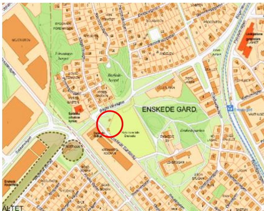
Karta som visar planområdets preliminära läge (röd ring) samt pågående detaljplaner i närområdet (1 Dp Bägersta Byväg, 2 Dp Rättikan 1).