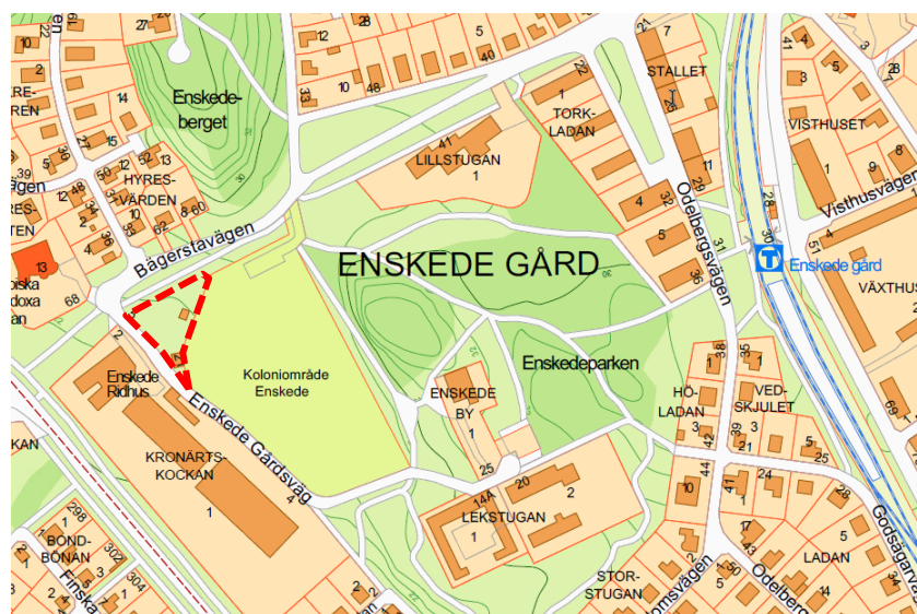
Karta som visar planområdets preliminära läge.

Planområdet ligger i sydvästra kanten av Enskedeparken och berör del av fastigheten Enskede Gård 1:1. Idag används byggnader och stor del av marken inom området för bageri- och caféverksamhet. Planområdet gränsar i norr till Bägerstavägen och i söder till Enskede ridskola och Enskede Gårdsväg.