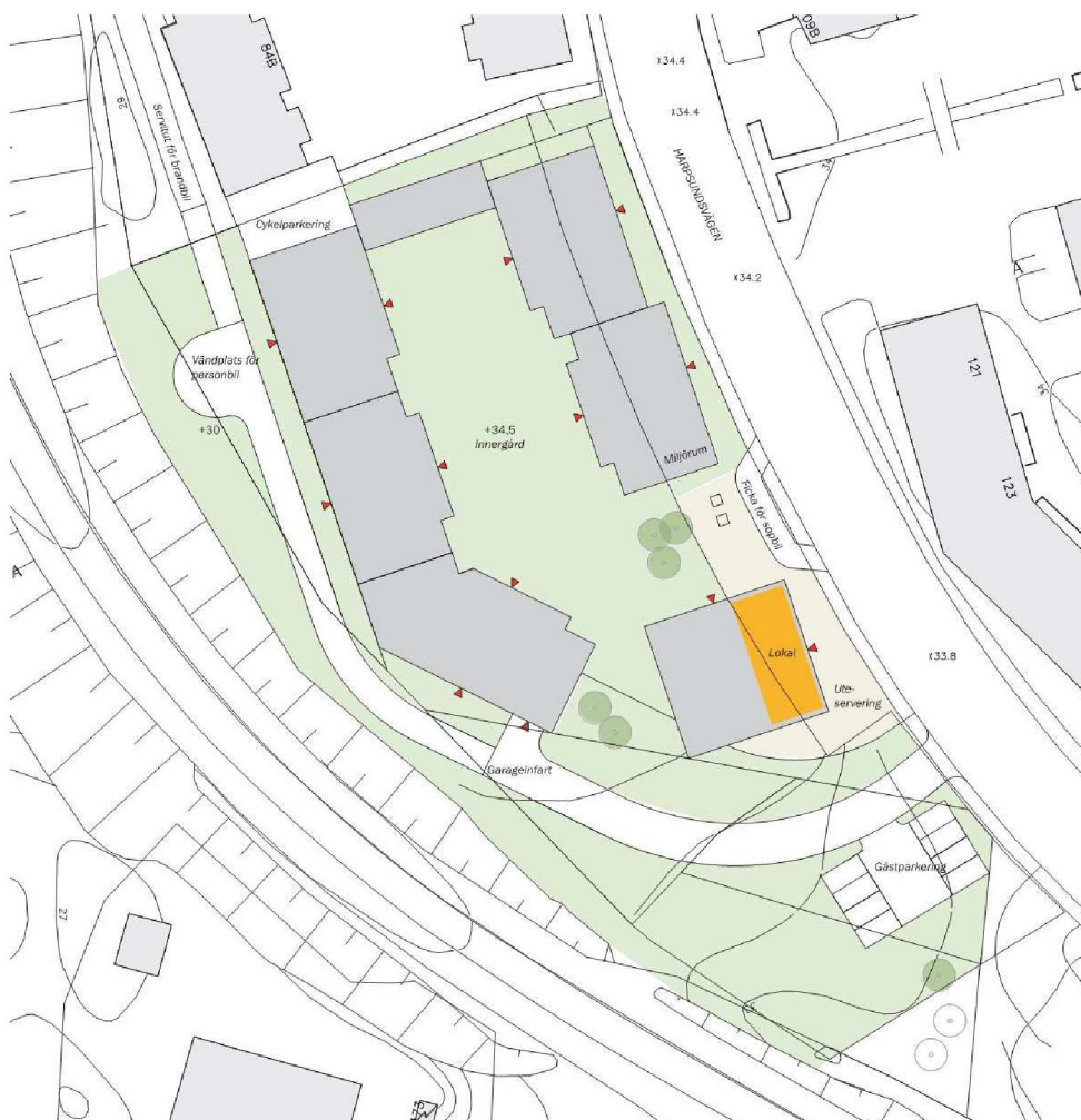
Figur 2.1 Situationsplan skissförslag 2019-09-09.

Botrygg planerar nybyggnation av 80-100 lägenheter på fastigheten Arkivfotot 2. Nybyggnation omfattar flerbostadshus och parkeringsgarage under den planerade innergården, se preliminär situationsplan i figur 2.1.