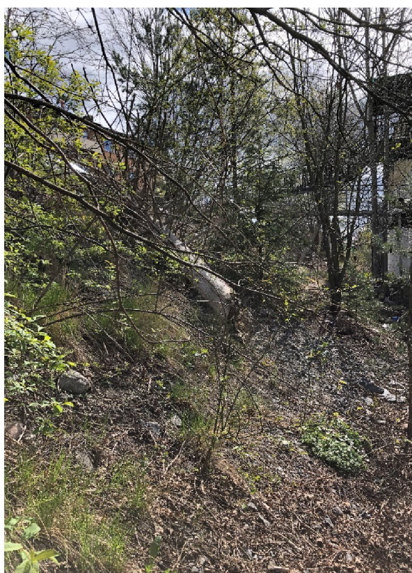
Figur 1: Provtaget området fotograferat i nordlig riktning (t.v.) och i sydlig riktning (t.h.) mot gångbryggan.