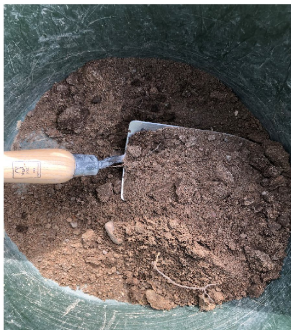
Figur 2: Bild på jord från provpunkt 20GA07 (t.v.) och provpunkt 20GA08 (t.h.)