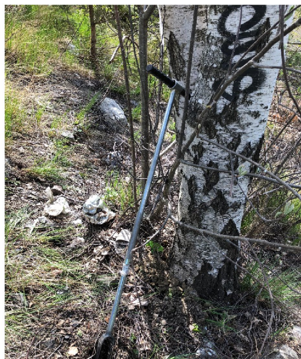
Figur 3: Provpunkt 20GA05 (t.v.) lokaliserad just under gångbryggan och provpunkt 20GA02 (t.h.) lokaliserad i provområdet norra del.