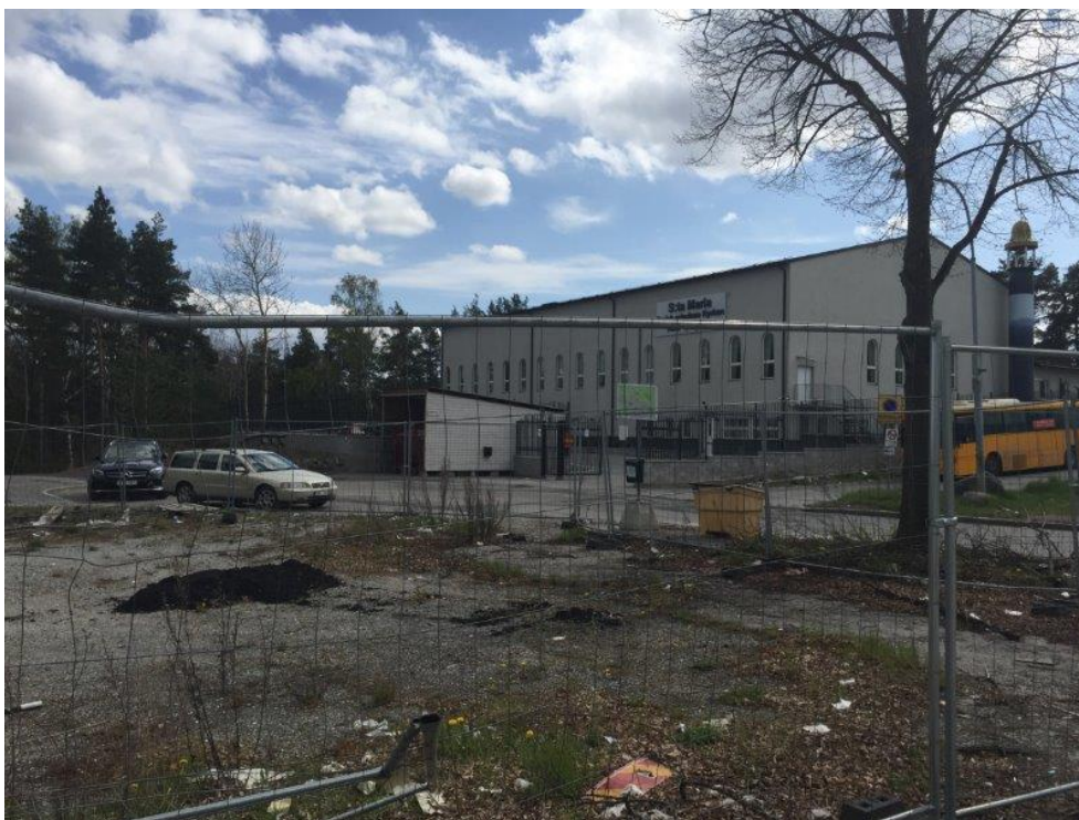
Intill nu aktuellt planområde finns också en större byggnad, kyrkobyggnad