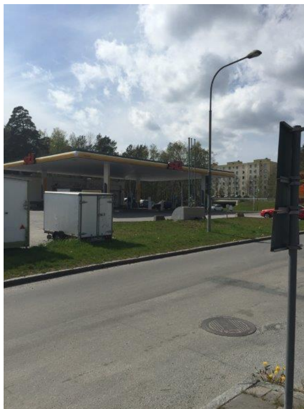
Planområde, innanför staketet där man planerar byggnation av ny restaurang, på andra sidan lokalgatan, Krällingegränd, en befintlig drivmedelsstation (St 1)