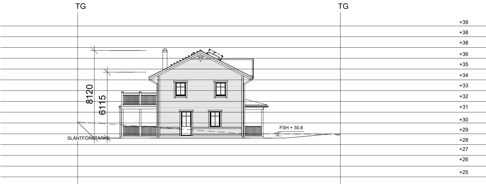
FASAD MOT SÖDER 1_200