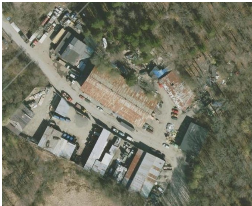
Ortofoto över tomt 17-26 som igår i anmälan.