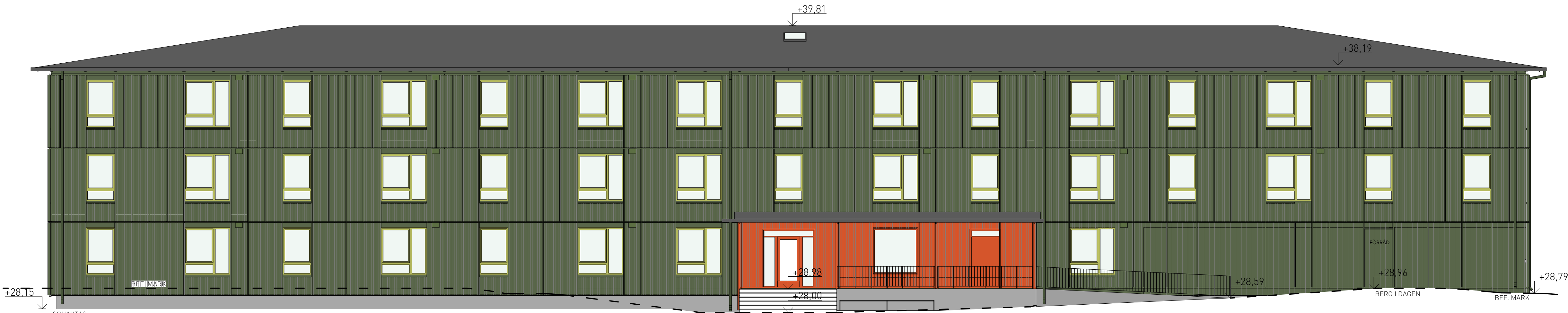
mot sydväst 1:100