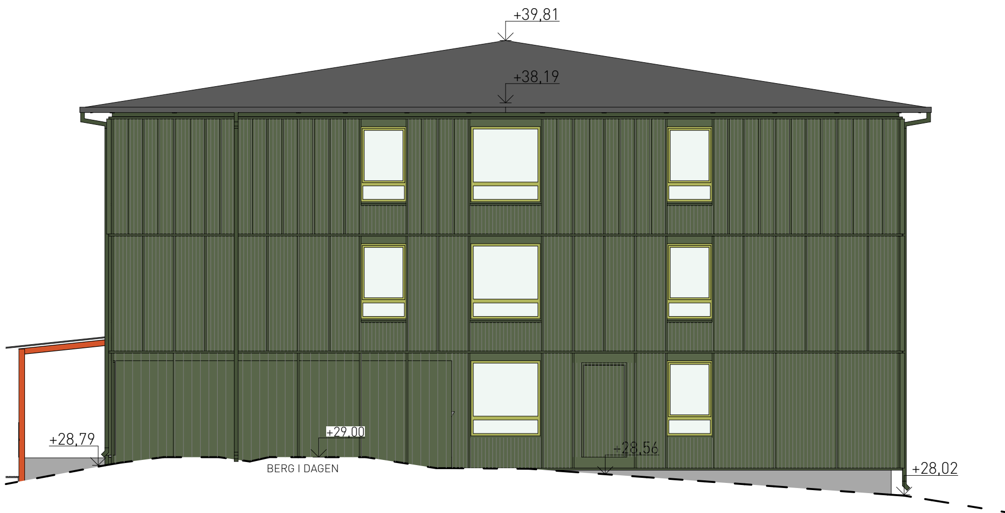
mot sydost 1:100