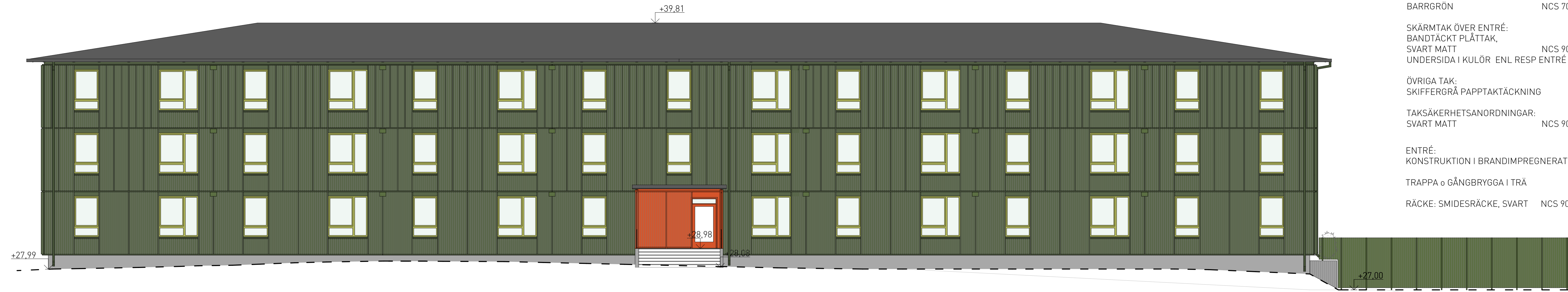
mot nordost 1:100