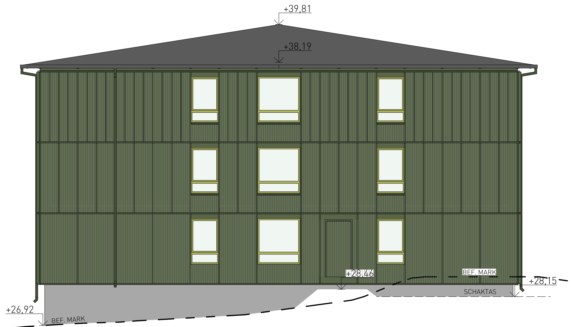
mot nordväst 1:100