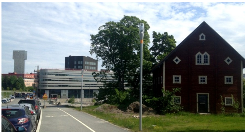
Kista Gård utmed Kista Alléväg, vy mot öster. NOD-kvarteret och hotellet Victoria Tower i bakgrunden. Magasinsbyggnaden som tillhört Kista Äng, till höger i bild, finns inte längre kvar.