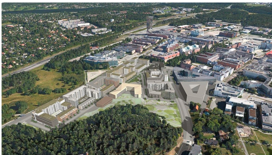
Vy från väst över planområdet. NOD-huset till höger i bild.

Kista Ängs föreslagna stadsbild utgår ifrån platsens skålliknande form, där omgivande gator och natur ligger högre än områdets mitt. Föreslagen bebyggelsestruktur bygger på omgivande gaturums riktningar, så att kopplingar och flöden till och inom området samt till omgivande kvarter och friytor stärks. Bebyggelsen, i form av tydligt avgränsade kvarter, placeras utmed Kista Alléväg, Borgarfjordsgatan och Torshamnsgatan. Kista Äng bygger på ett stadsbyggnadskoncept som har tre vägledande delar: kilen, stadsbilden och gatustrukturen. Tillsammans bildar de en grund och en gemensam bild för stadsbyggandet i Kista Äng.