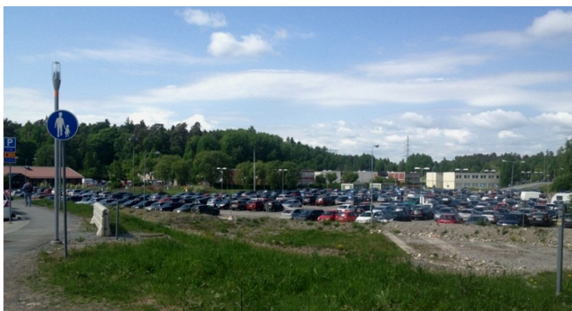
Idag kännetecknas planområdet av en stor markparkering. Vy från korsningen Borgarfjordsgatan och Kista Alléväg.

Den östra delen av området hade varit bebyggd med studentbostäder av mycket tillfällig karaktär. I dagsläget har i stort sett alla byggnader rivits och en del av marken har ersatts med markparkering. En lägre tegelbyggnad från studentanläggningen finns kvar i området.