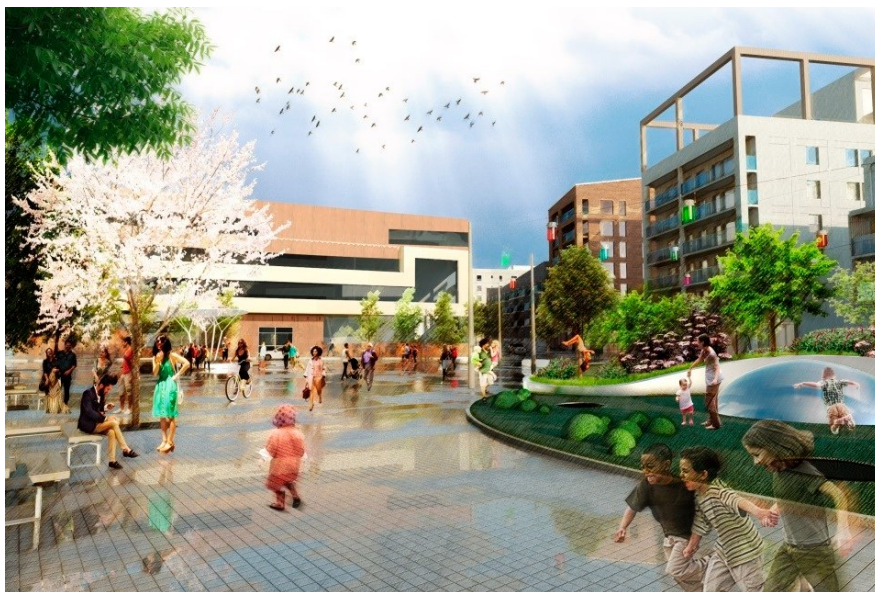
Vy över det centrala torget. Illustration: Landskapslaget.

I Kista Äng planeras tre torg som genom placering, storlek och utformning erbjuder området olika möjligheter till stadsliv. Det centrala torget ligger i den östra spetsen av kilen och blir med generösa ytor för möten, aktiviteter och event, områdets centrala punkt, liksom allmänhetens mötesplats. Det ska vara naturligt att ledas hit från den urbana axeln.