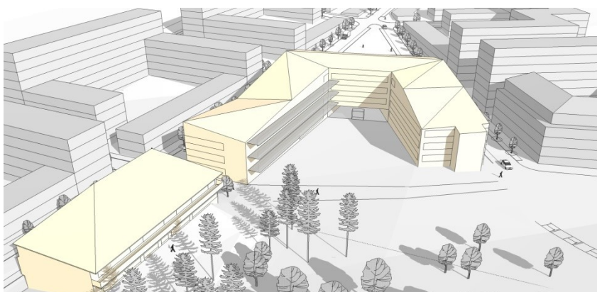
Skolbyggnaden placeras centralt i området och får en hästskoformad volym som följer gatornas riktning. Vy från väster. Illustration: Stadion Arkitekter.

En F-6 skola för ca 630 elever och 12 förskoleavdelningar planeras i området. Skolbyggnaden placeras centralt i kilen med entrésida mot det centrala torget och en skolgård sammanvävd med stadsparken. Skolan ska genom sitt uttryck och sin placering ”mitt i byn” bidra till stadsdelens karaktär av att vara det senaste i det innovativa Kista. Föreskriven byggrätt för skolbyggnaden lämnar en marginal för utökning av antal elever i skolan upp till 900.