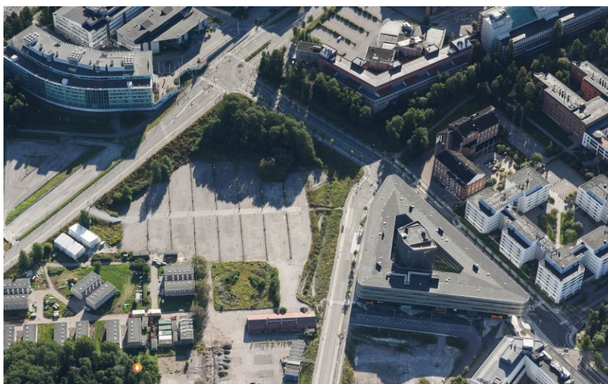
Del av planområdet utgörs idag av markparkering. NOD-huset till höger i bild.

Den östra delen av området hade varit bebyggd med studentbostäder av mycket tillfällig karaktär. I dagsläget har i stort sett alla byggnader rivits och en del av marken har ersatts med markparkering. En lägre tegelbyggnad från studentanläggningen finns kvar i området.