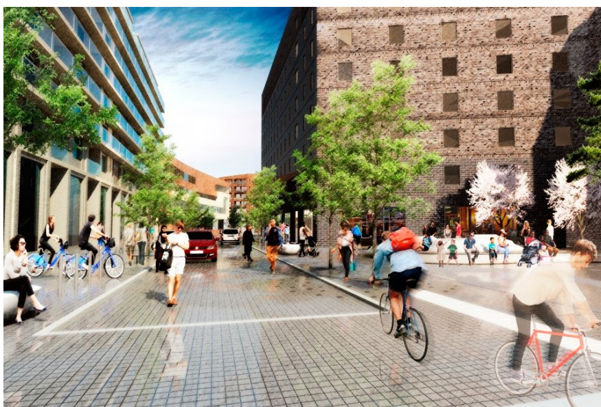
Vy över den urbana axeln och Entrétorget. Illustration: Landskapslaget.

Den urbana axeln är områdets primära stråk, kantat av verksamheter och service. Det ingår i ett större sammanhängande stråk som har en stor potential att bli ett av Kistas viktiga och levande gångstråk från Kista tunnelbanestation till Torshamnsgatan. Entrétorget vid korsningen Kista Alléväg/urbana axeln blir den naturliga entrén till Kista Äng från Kista tunnelbanestation och centrum.