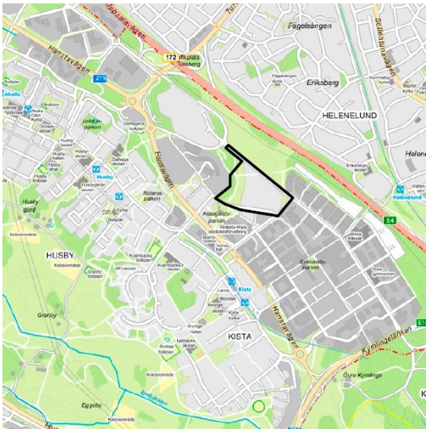
Kista med planområdet markerat