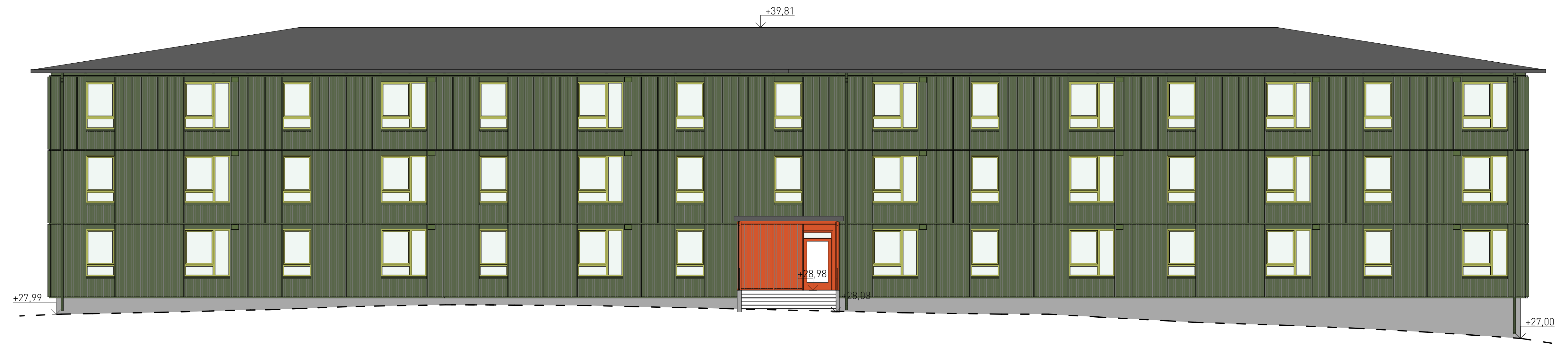
mot nordost 1:100