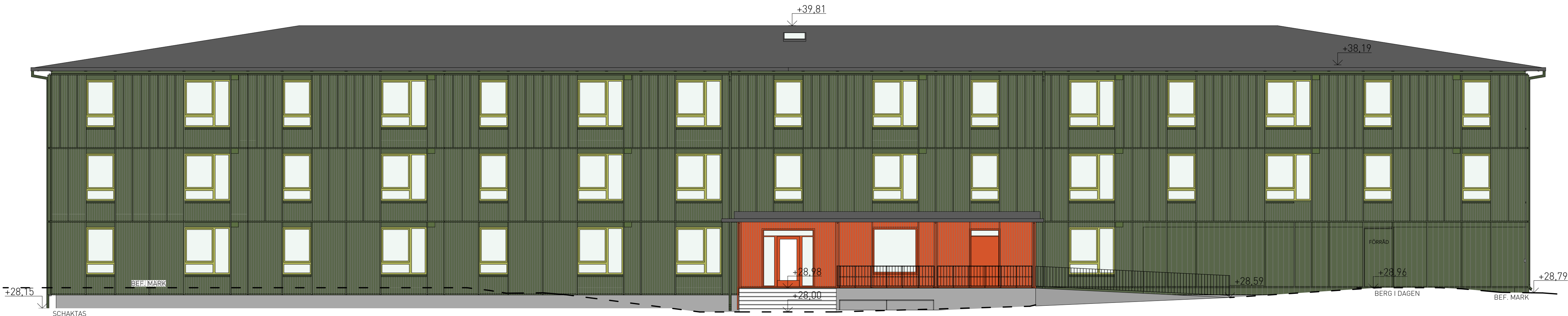
mot sydväst 1:100