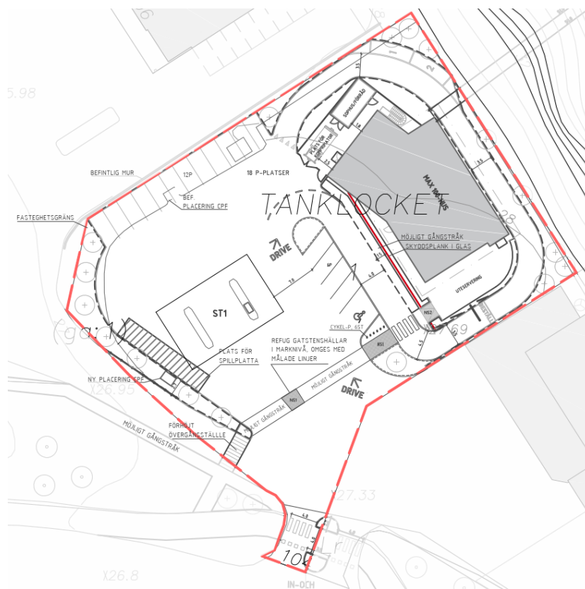
Situationsplan. Planområdet är markerat med röd-streckad linje. Skyddsplanen är markerat med röd heldragen linje.

Planen möjliggör för fortsatt användning av befintlig drivmedelsförsäljning (G) i planområdets sydvästra del samt uppförande av restaurangverksamhet (C 1 ) i den nordöstra delen av planområdet. Planområdets södra del, i höjd med in- och utfarten till fastigheten, planläggs som allmän plats GATA.