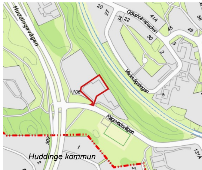
Karta som visar planområdets avgränsning, markerat med heldragen röd linje.

Planområdet omfattar fastigheten Tanklocket 1 i stadsdelen Rågsved och omfattar cirka 3100 kvm. Fastigheten Tanklocket 1 är belägen vid korsningen mellan Huddingevägen och Rågsvedsvägen. Marken ägs idag av Stockholms stad och upplåts med tomträtt till St1 Sverige AB. Inom planområdet finns bensinpumpar med skärmtak samt ett mindre mätarskåp. Marken är i huvudsak hårdgjord.