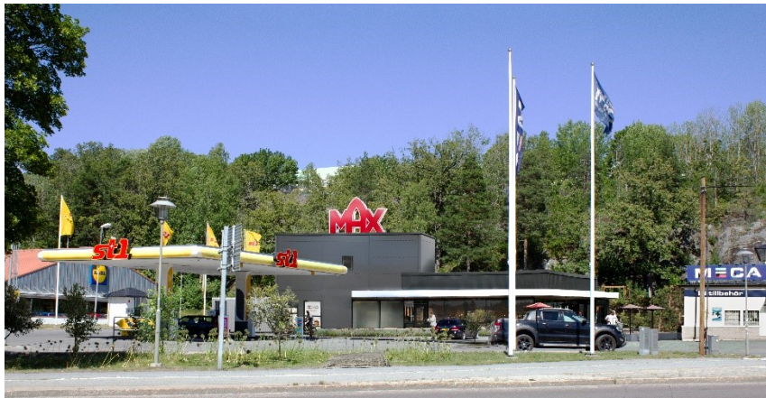
Perspektiv över befintlig drivmedelsanläggning och tillkommande restaurangbyggnad.