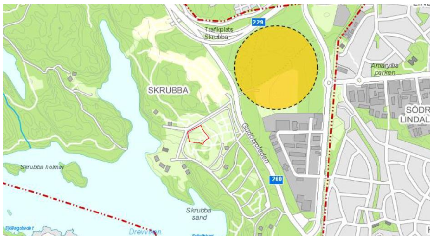
Karta som visar ungefärligt planområde (röd linje) samt område med pågående detaljplan för verksamheter i Skrubbaträngeln (gul cirkel).