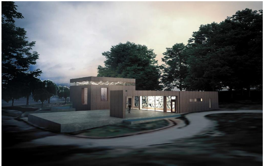
Illustration av den tilltänkta ceremonibyggnaden i Strandkyrkogården, A-sidan arkitektkontor.

I det fortsatta arbetet med detaljplanen kommer frågan om angöring och parkeringsbehov för besökare att utredas vidare.