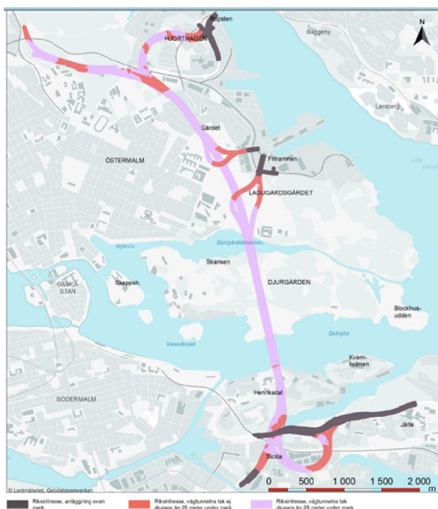
Figur 2. Riksentressets utbredning för Östlig förbindelse

Riksintressepreciseringen för Östlig förbindelse innebär att det skapas ett reservat som har till uppgift att se till att inget byggs som kan komma att påverka eller äventyra Östlig förbindelse vid ett eventuellt framtida genomförande. De ytor som redovisas i riksintressepreciseringen kommer från den avbrutna lokaliseringsutredningen. Något val av lokalisering av vägen har formellt inte gjorts enligt Väglagen.