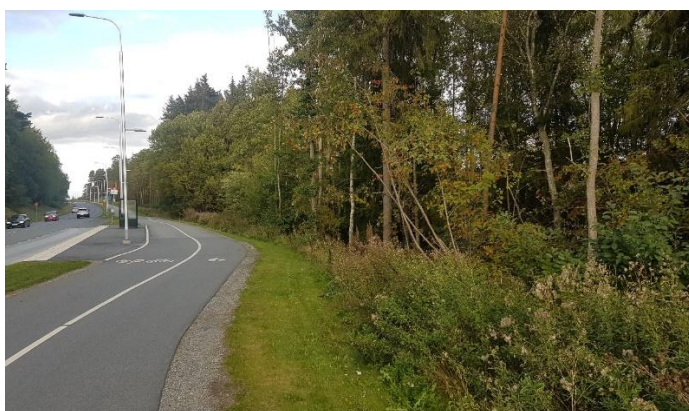
Figur 2: Foto taget längs Växthusvägen. Foto taget i nordlig riktning med detaljplaneområdet på högra sidan om vägen.

Detaljplaneområdet utgörs idag av naturmark precis öster om Växthusvägen samt den cykelväg som löper längs med Växthusvägens östra sida. Naturmarken utgörs av mindre buskage och träd, se Figur 2 - 3.