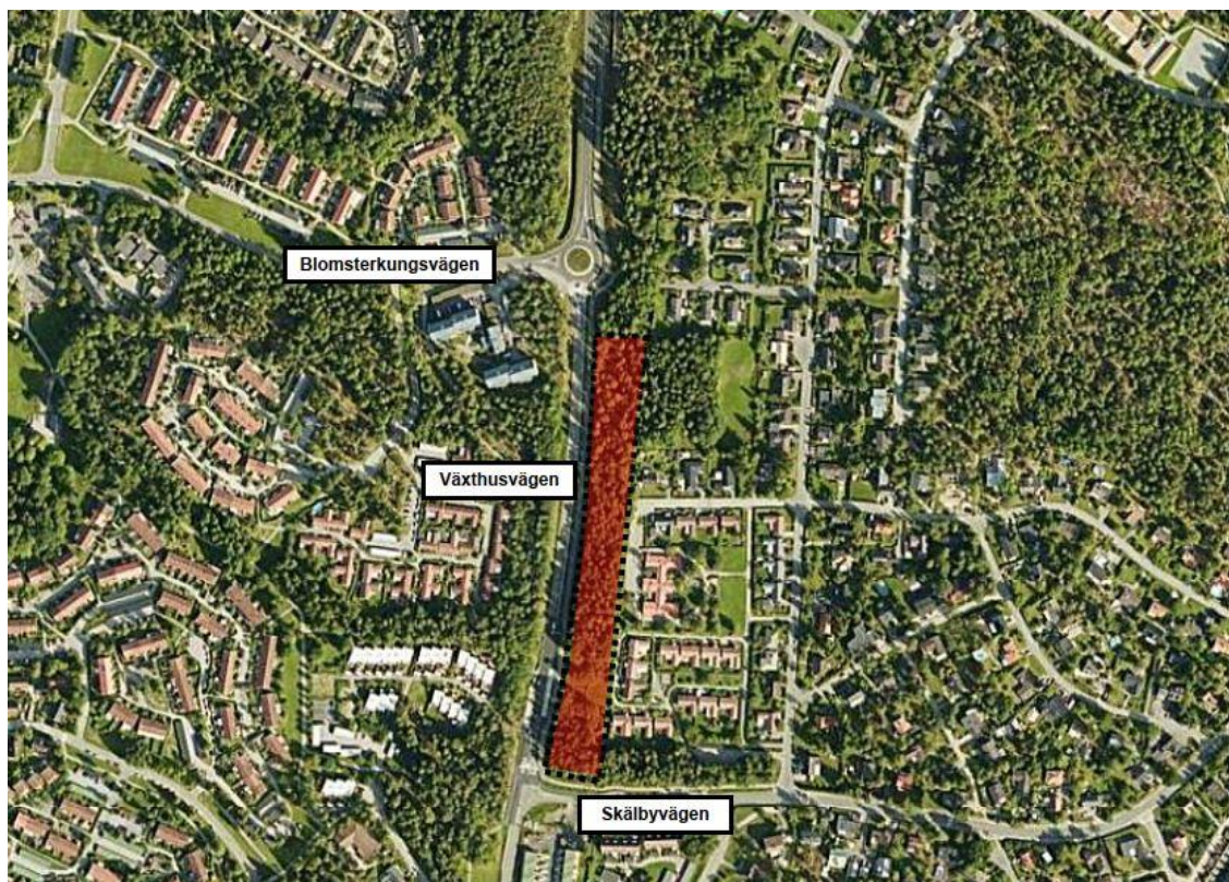
Figur 1: Planområdets ungefärliga utbredning markerat i rött (www.eniro.se 2019-10-07)

På uppdrag av Skanska Sverige AB har Orbicon AB utfört en miljöteknisk undersökning för detaljplan längs Växthusvägen, Järfälla. Se Figur 1 för detaljplaneområdets ungefärliga omfattning.