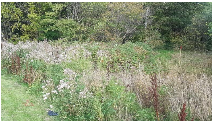
Figur 3: Foto taget längs Växthusvägen. Foto taget i nordöstlig riktning och visar hur naturmarken generellt ser ut.

Detaljplaneområdet består av naturmark som i väster avgränsas av Växthusvägen samt den Gång- och cykelväg som löper på östra sidan längs med Växthusvägen, i söder av Skälbyvägen samt den GC-väg som löper på norra sidan längs med Skälbyvägen, i öst av fastigheter, Zenitvägen och Polarisvägen och i norr av fortsättning av naturmarken.