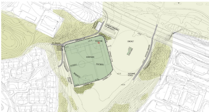
Illustrationsplan över möjlig utformning av idrottsanläggningen. Illustration: LAND Arkitektur

Hänsyn ska tas till framtida utveckling av hela Spångadalen och Rinkebydalen och detaljplanen ska förhålla sig till Program för Spångadalen .