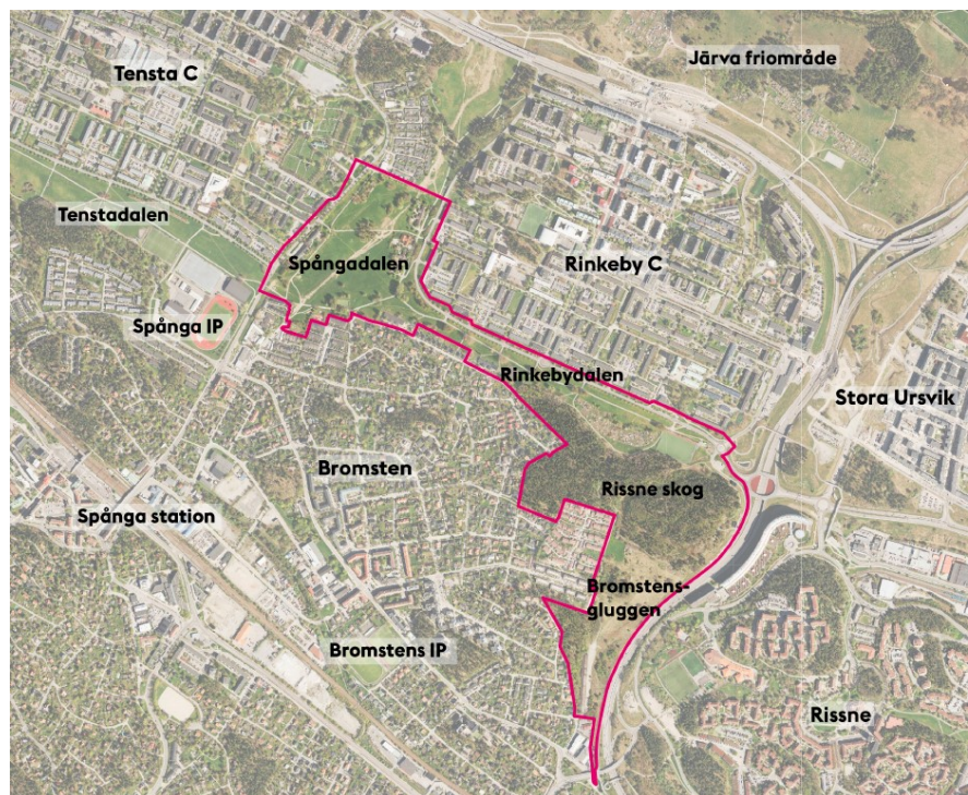
Avgränsning för Program för Spångadalen.