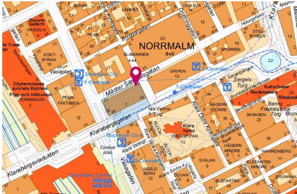
Figur 1. Fastighetens placering i Norrmalm i centrala Stockholm. Fastigheten är färgmarkerad och har en röd pil på sitt nordöstra hörn. (Stockholms stad, 2019)

Fastigheten Orgelpipan 7 har en yta på 6293 m 2 och ligger mitt på Norrmalm i centrala Stockholm (Stockholms stad, 2019). Flervåningshuset utgör ungefär två tredjedelar av fastighetens yta (Figur 1).