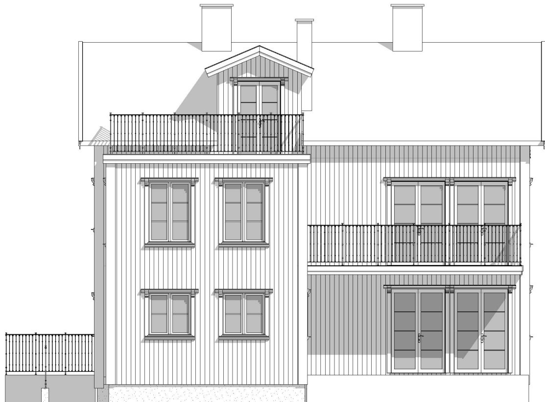
Fasad mot Nordväst 1:100