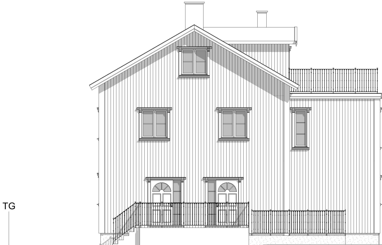
Fasad mot Nordöst 1:100