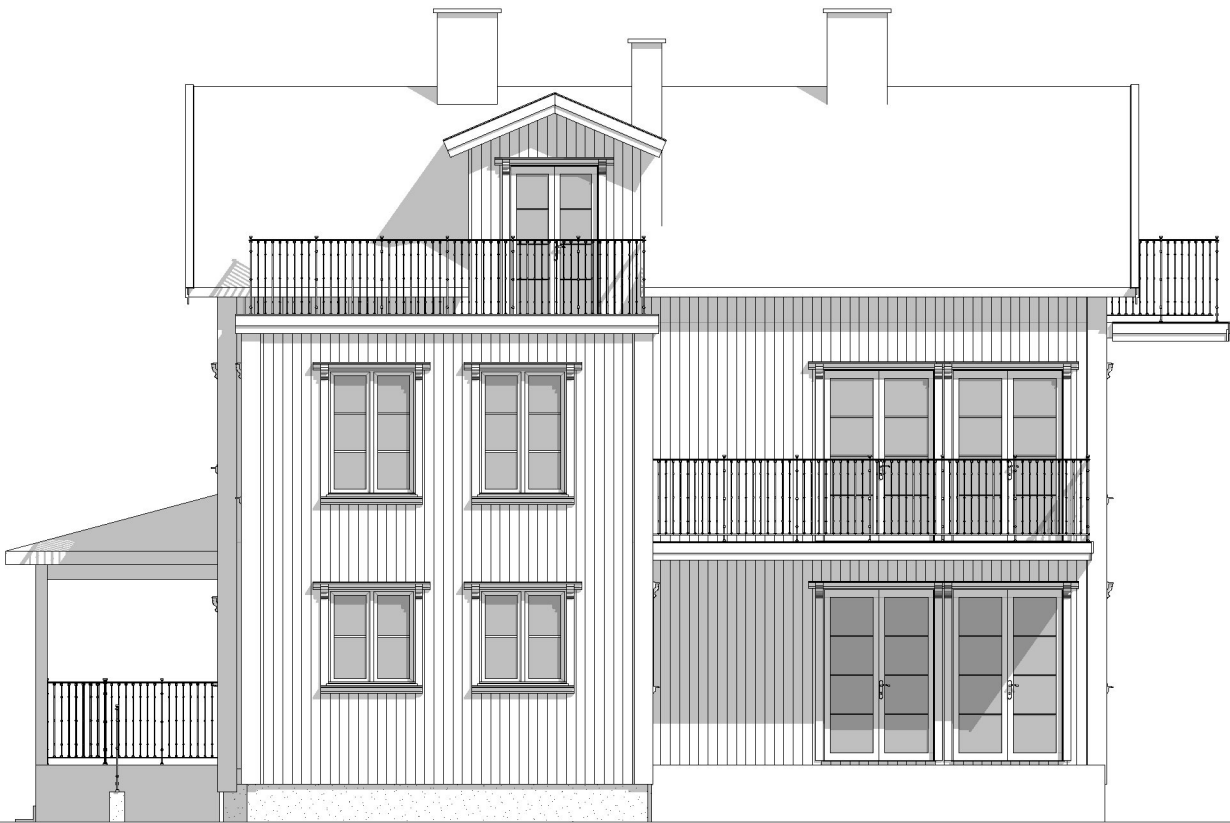
Fasad mot Nordväst 1:100