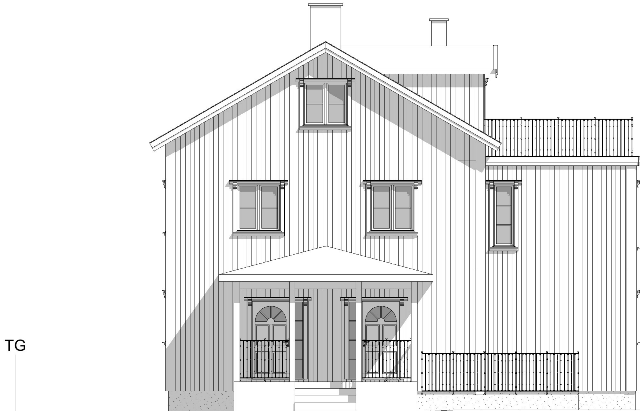
Fasad mot Nordöst 1:100