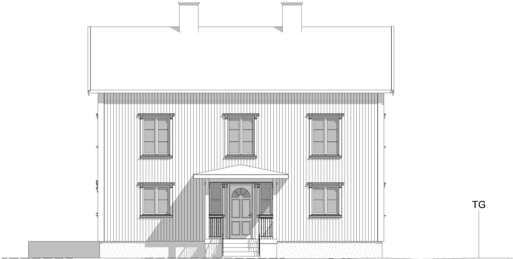
Fasad mot Sydväst 1:100