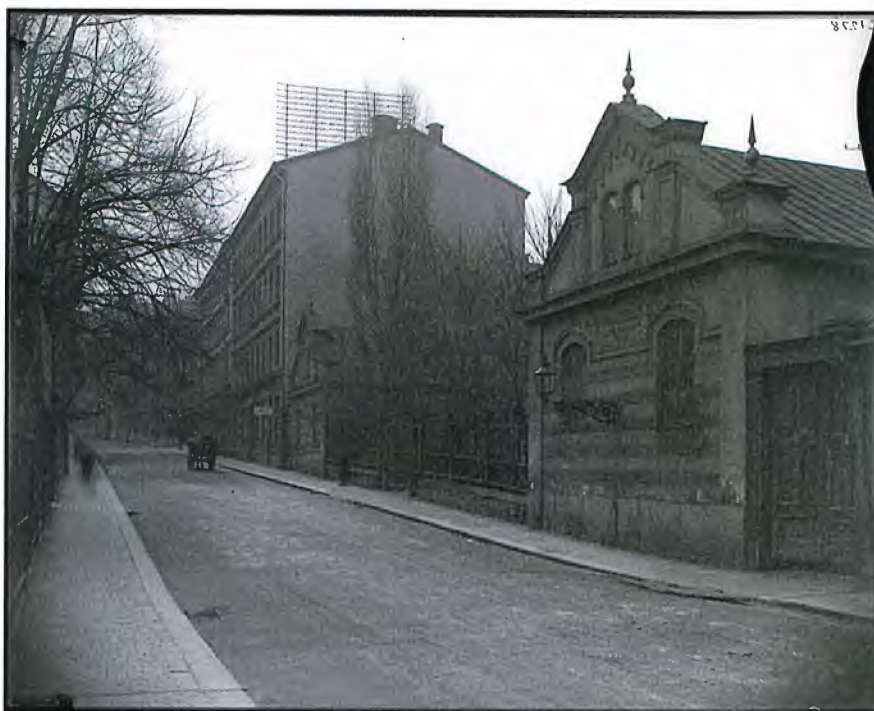
Grev Turegatan norrut år 1896. Närmast i bild syns ridhuset därefter Riddaren 15 och 16 uppförda på 1860-talet.