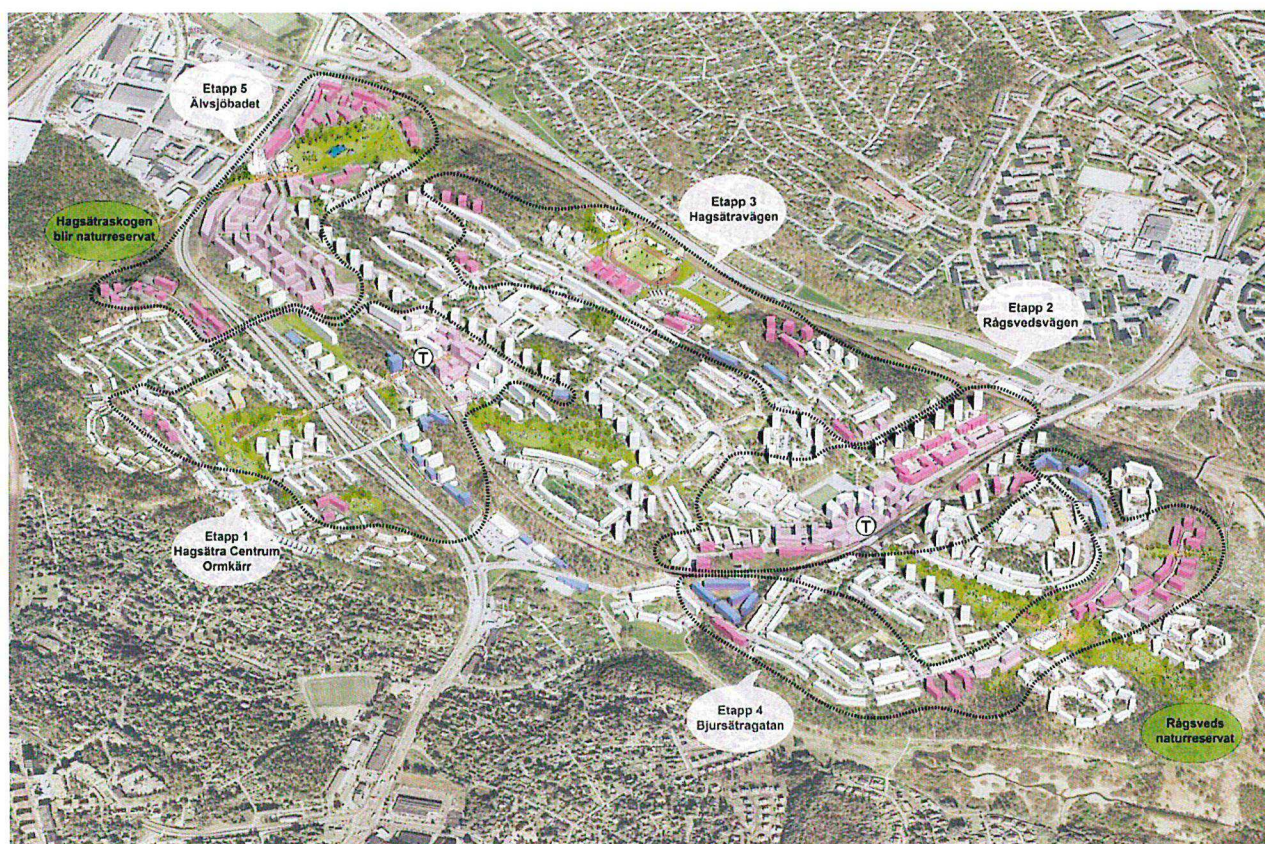
Bild: Översiktsillustration Fokus Hagsätra-Rågsved. Blå byggnader visar pågående projekt.

Kontoren föreslår vissa revideringar utifrån samrådssynpunkterna, områdets ekologiska kärnvärden samt att det i planeringen för Fokus Hagsätra Rågsved framkommit vikten av att stärka både rekreativa samband och spridningssamband samtidigt som relativt omfattande ny bebyggelse möjliggörs i andra gröna samband.