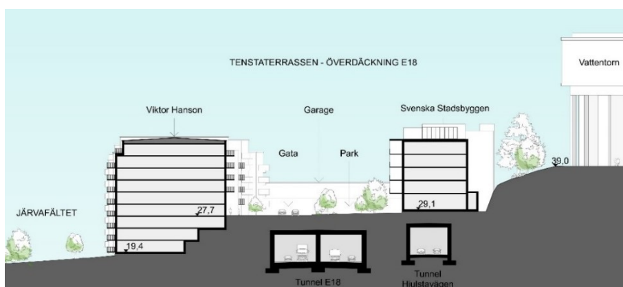
Sektion genom Tensterrassen (ÅWL Arkitekter).

Bostadshusen mot Järvafältet är orienterade i en solfjädersform där gårdarna öppnar sig mot kulturlandskapet. Genom läget i slutningen skapas en naturlig dynamik då byggnaderna följer topografin. Den svängda gatan förmedlar en rörelse som också bidrar till att skapa variation till bostadshusens entréplatser. Ett gestaltat räcke, häck eller mur avgränsar lokalgatan och de gröna slänterna. Alla bostadsentréer ligger mot söder och är indragna från gatan. Varje bostadshus har tillgång till vistelseyta i den nedre delen av gården med en gårdsentré på nedersta våningen. Husens övre våningar är trappade i höjd. Fasaderna utförs i puts med inslag av trä, tegel eller skivmaterial.