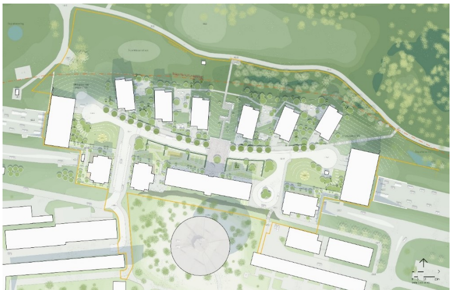
Bebyggelsens placering ovan E18. Järvafältet i norr och Tensta runda vattentorn i söder. (Sweco Architects)

Bebyggelsens placering främjar utblickar mot landskapsrummet. Den är placerad kring en angöringsgata som är kopplad till Föllingebacken. Angöringsgatan har en böjd mjuk form som bryter mot Tenstas rätvinkliga gatunät. Gatan skapar en riktning mot fältet. Överdäckningen fungerar som en brygga och entré mellan Tensta, Järvafältet och Norra Järva. En styrande förutsättning för husens placering är att de av säkerhetsskäl inte kan placeras på E18:s tunneltak, inte kan vara sammanhängande eller förläggas närmare än åtta meter från tunnelväggarna om normal stomme ska nyttjas.