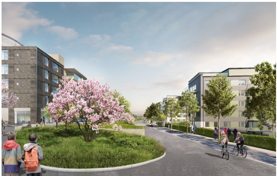
Parkstråket på Tenstaterrassen med vårdbyggnaden till vänster och husen mot fältet till höger (ÅWL arkitekter).

Ett bostadshus i fem våningar föreslås öster om vårdbyggnaden. Byggnadens fasader föreslås vara i ljus puts med de två nedersta våningarna i skiv- och trämaterial. En gemensam uteplats planeras på byggnadens tak. Detaljplanen möjliggör även för eventuellt korttidsboende med medicinsk vård i byggnaden.