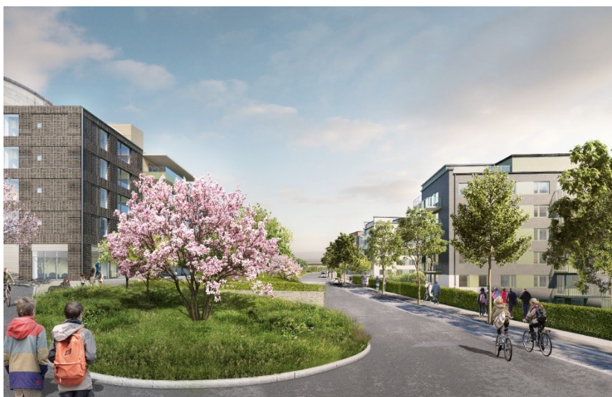
Parkstråket på Tenstaterrassen med vårdbyggnaden till vänster och husen mot fältet till höger (ÅWL arkitekter).

Ett bostadshus i fem våningar föreslås öster om vårdbyggnaden. Byggnadens fasader föreslås vara i ljus puts med de två nedersta våningarna i skiv- och trämaterial. En gemensam uteplats planeras på byggnadens tak. Detaljplanen möjliggör även för eventuellt korttidsboende med medicinsk vård i byggnaden.