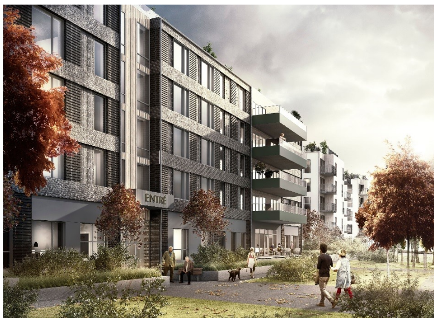
Vårdbyggnaden och entréhusen (Krook & Tjäder).

Ett bostadshus i fem våningar föreslås öster om vårdbyggnaden. Byggnadens fasader föreslås vara i ljus puts med de två nedersta våningarna i skiv- och trämaterial. En gemensam uteplats planeras på byggnadens tak. Detaljplanen möjliggör även för eventuellt korttidsboende med medicinsk vård i byggnaden.