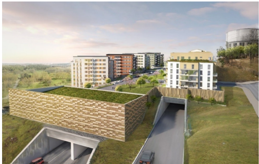
Västra garaget, bostadshuset samt bullerplank (ÅWL).

Det lägesspecifika parkeringstalet för bil för Tenstaterrassen är 0,55 platser/lägenhet och det projektspecifika parkeringstalet 0,53 platser/lägenhet. Möjlighet finns att genomföra mobilitetsåtgärder, vilket gör att parkeringstalet kan minska.