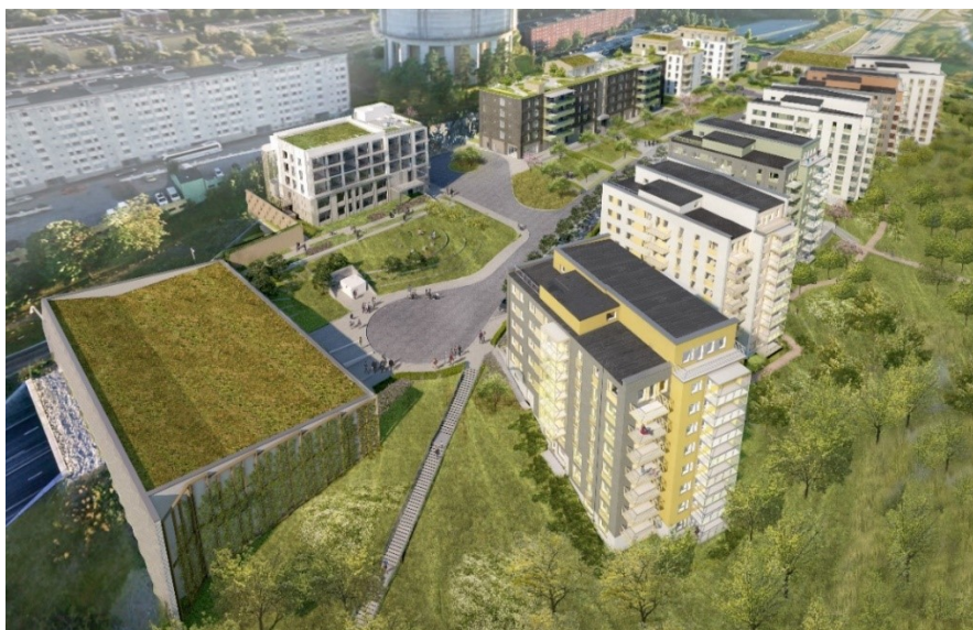
Flygvy mot sydväst (ÅWL arkitekter).

Bostadshusen mot Järvafältet är orienterade i en solfjädersform där gårdarna öppnar sig mot kulturlandskapet. Genom läget i slutningen skapas en naturlig dynamik då byggnaderna följer topografin. Den svängda gatan förmedlar en rörelse som också bidrar till att skapa variation till bostadshusens entréplatser. Ett gestaltat räcke, häck eller mur avgränsar lokalgatan och de gröna slänterna. Alla bostadsentréer ligger mot söder och är indragna från gatan. Varje bostadshus har tillgång till vistelseyta i den nedre delen av gården med en gårdsentré på nedersta våningen. Husens övre våningar är trappade i höjd. Fasaderna utförs i puts med inslag av trä, tegel eller skivmaterial.