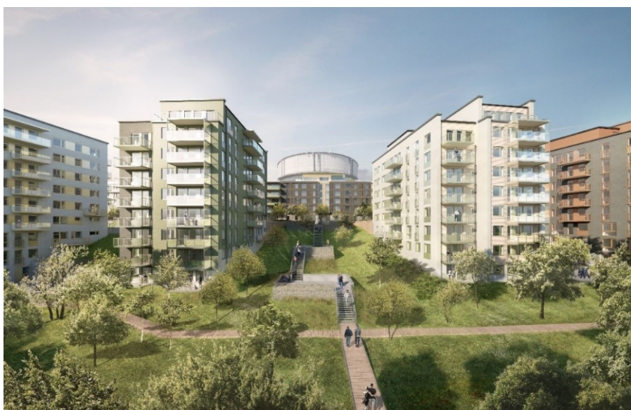
Park med trappa upp till Tenstaterrassen. Vattentornet i fonden (ÅWL arkitekter).

Entréerna till husen mot Järvafältet nås från gatuplan. De lägre vistelseytorna mot fältet nås tillgängligt via husens hissar och gårdsentréer. Vistelseytor för bostäderna söder om lokalgatan nås tillgängligt via minst en gångväg. Vistelseytor på taken för de boende nås via hiss. Handikappangöring och parkering kan anordnas längs gatan inom högst 15 meter från samtliga entréer. Handikapparkering möjliggörs även i garagen. Entrén till vårdboendet är tillgänglig och två handikapparkeringar finns i parkeringsfickor på entrétorget. På grund av stora höjdskillnader har det inte varit möjligt att uppnå full tillgänglighet mellan terrassen och fältet. En gång- och cykelväg har ingående prövats men en strategisk ledning som varken kan flyttas eller överbyggas har hindrat en sådan lösning. Förutom kostnads- och driftsskäl har en hiss inte bedömts som lämplig då enda läge är i ett undanskymt och potentiellt otryggt läge bortom det västra garaget vid tunnelmynningen, närmare 100 meter från GC-vägen på fältet.