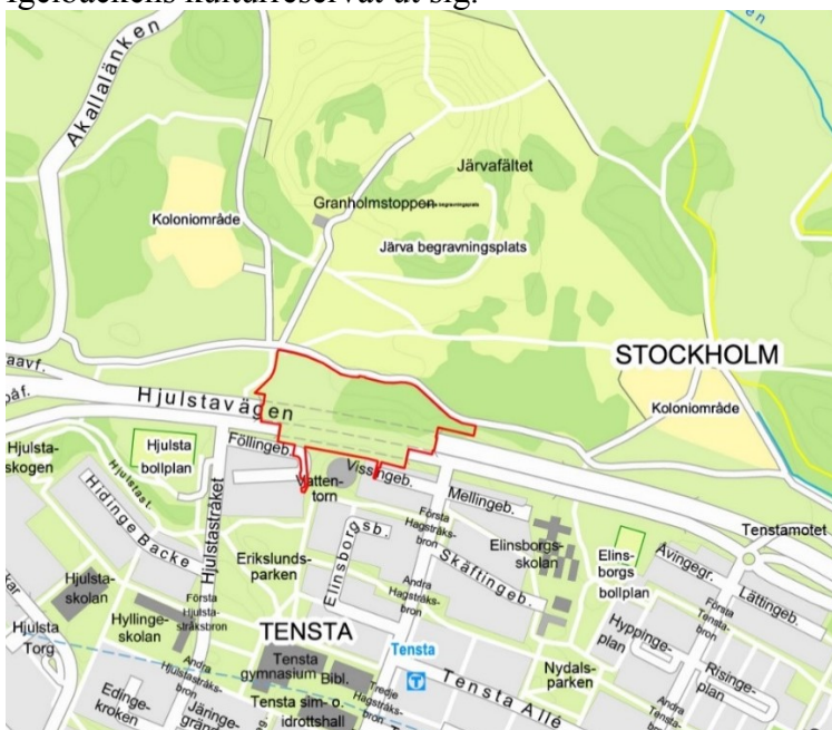
Karta som visar planområdets avgränsning med röd linje.

Planområdet omfattar överdäckningen av E18 och Hjulstavägen (Tenstaterrassen) samt en mindre del av Järvafältet. De fastigheter som berörs är Akalla 4:1, Drevinge 1, Bålinge 1 och Vissinge 1. Området angränsar till befintlig elnätstation och parkeringsgarage vid Föllingebacken, Tensta vattentorn samt parkeringsgaraget vid Vissingebacken. Norr om planområdet breder Järvafältet och Igelbäckens kulturresevat ut sig.