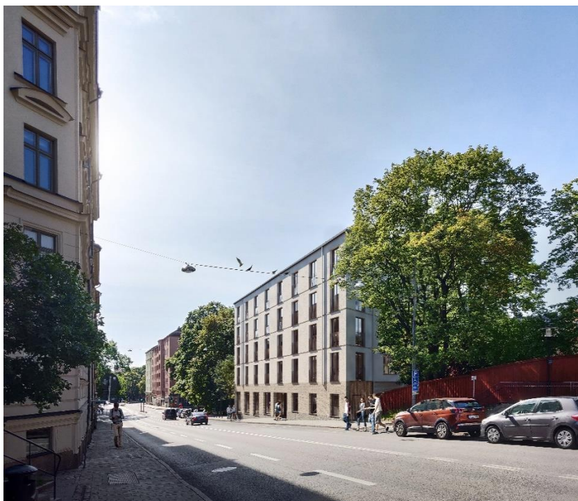
Det planerade huset sett från Renstiernas gata norrifrån (Belatchew arkitekter).

Möjlighet till boendeparkering för bil ordnas i Stigbergsgaraget, cirka 600 meter från planområdet, med ett lägesbaserat parkeringstal (cirka 0,4 platser per lägenhet). Föreslagen ny bebyggelse ska anordna cirka 90 cykelplatser i källarvåningen, vilket motsvarar cirka fem cykelparkeringsplatser per lägenhet.