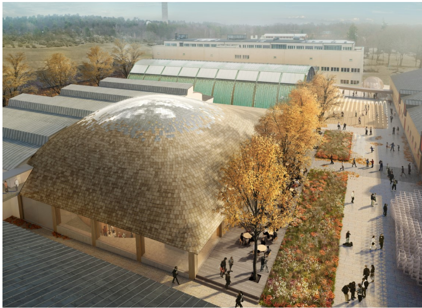
Vy över tillbyggnad med gårdsmiljö