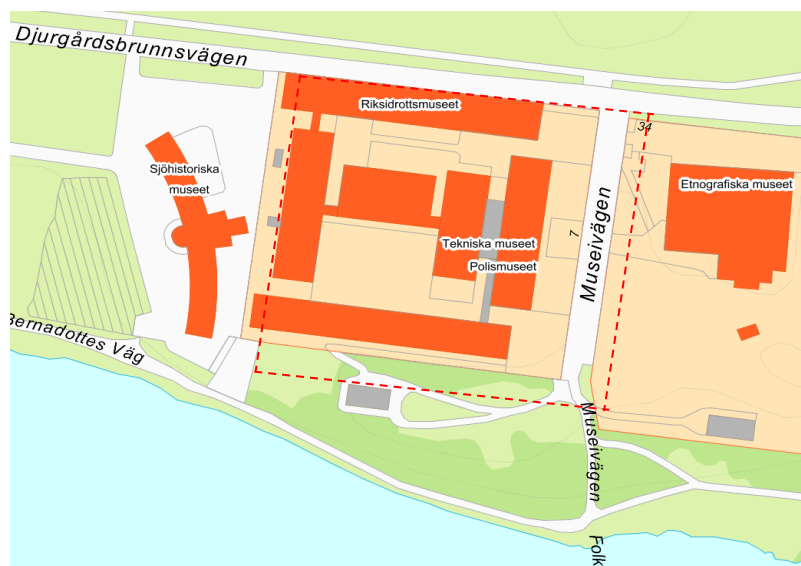
Karta som visar planområdets avgränsning

Planområdet ingår i Ladugårdsgärdet i Södra Djurgården och omfattar ca 28 000 kvm.