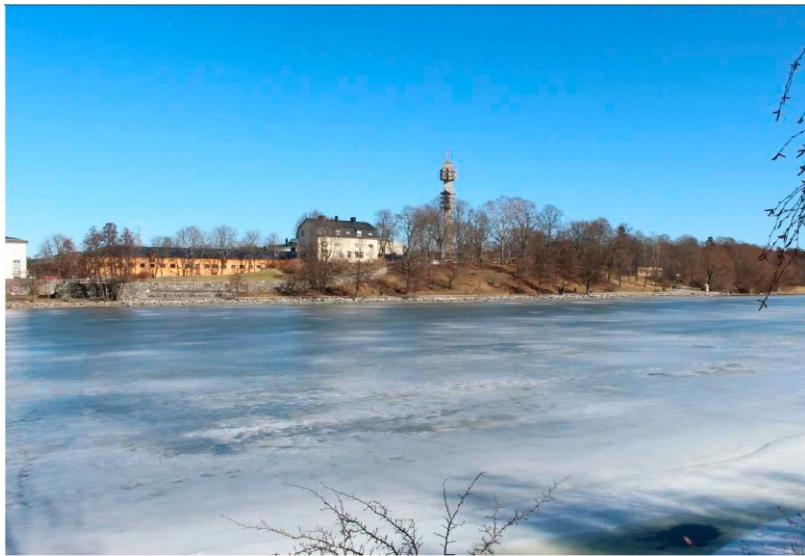
Vy från andra sidan Djurgårdsbrunnsviken