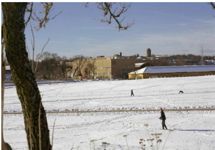
Vy från Gärdet med huvudbyggnaden i funktionalistisk stil och Norra stallet som är en av de karaktäristiska äldre reglementsbyggnaderna i museianläggningen.