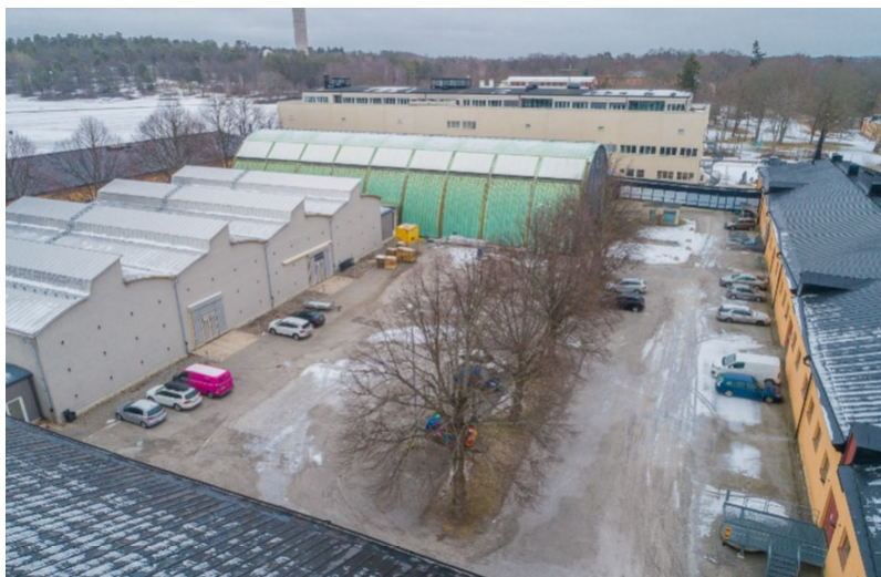
Vyer över museets innergård med de 5 lindarna