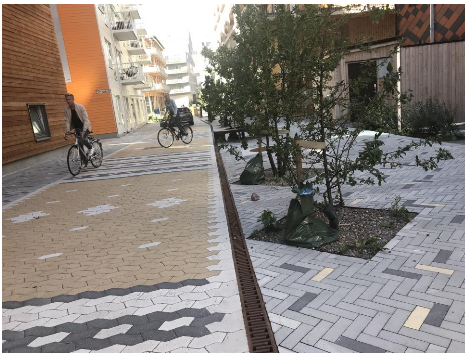
Figur 5. Fotgängar- och cykelvänlig gata i Vallastaden som kan tjäna som inspiration för utformning av Nya gatan, dock med notering om att Nya gatan anläggs med trottoarer för att ge tryggare fotgängarrörelser på grund av varuleveranser.