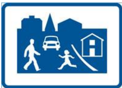
Figur 4. Vägmarke för gångfartsområde

Där lassning, lossning och kantstensparkering sker blir kvarvarande körbar yta ca 4 m. Det är för smalt för möte bil + bil men fungerar för bil + cykel. Om lastning och lossning ordnas i korta sektioner med plats och fri sikt för möte var 20-40 meter kan gatan fortsatt göras dubbelriktad för motorfordon.