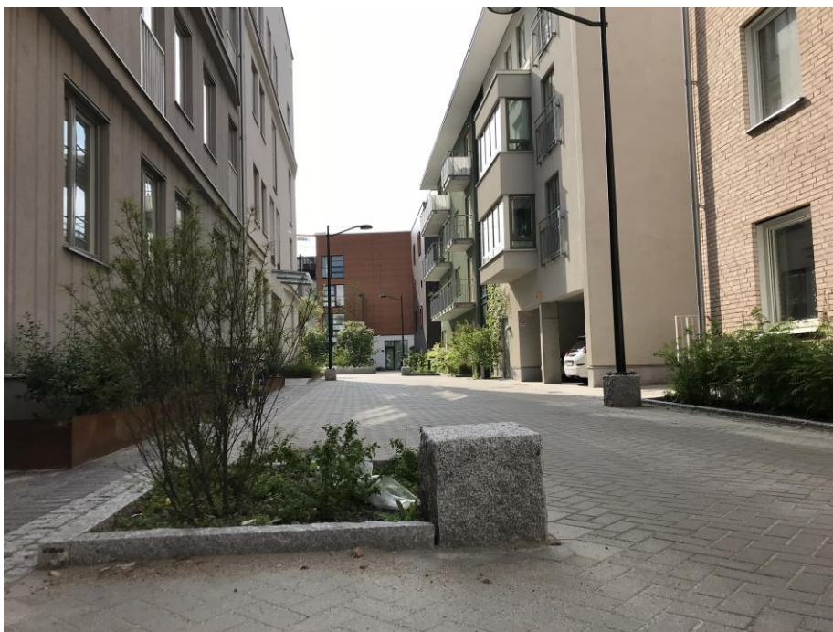
Figur 6. Växtbädd i den körbara ytan. Exempel på utformning från gata i Malmö som ger korta raka sektioner för motortrafiken och på så sätt prioriterar fotgängares rörelse och vistelse.