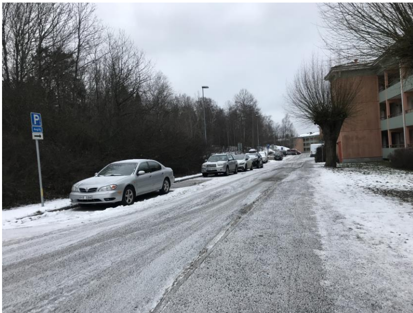
Figur 1. Söderberga gårdsväg. Vy tagen mot söder i december 2018.

Söderberga gårdsväg är bostadsområdets huvudsakliga entré för motortrafik och även en viktig länk för rörelser till fots och med cykel.