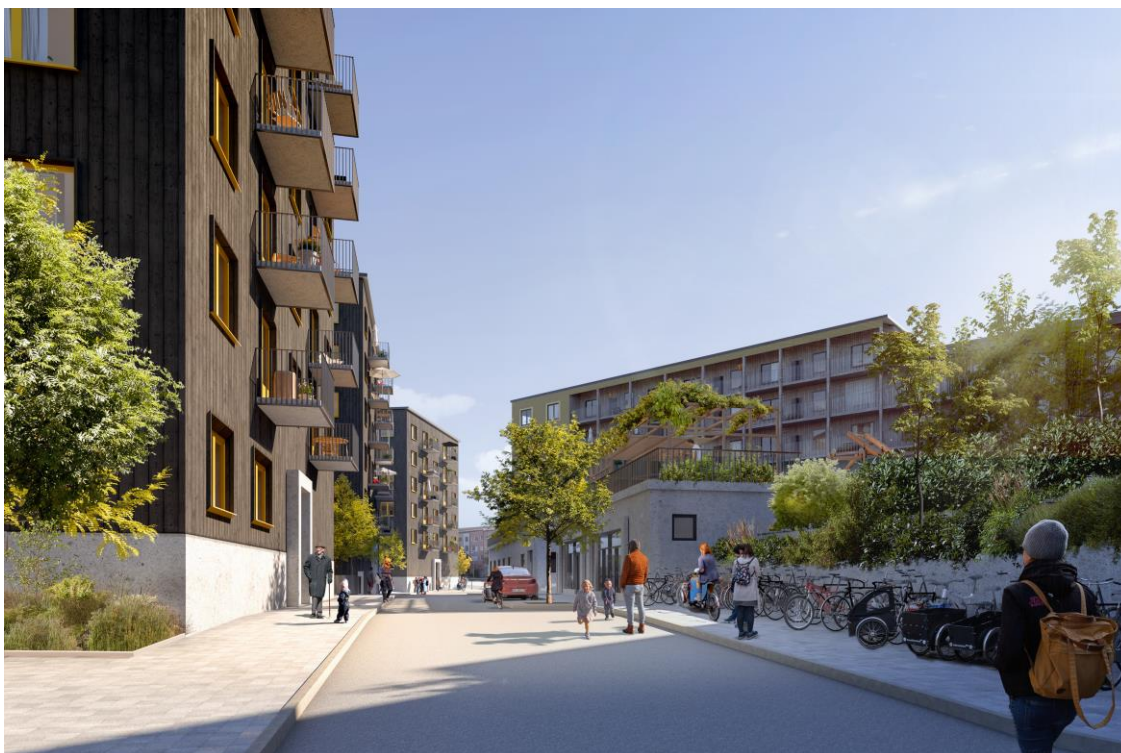
Figur 3. Illustrationsbild längs Nya gatan. Vy mot sydöst. Illustration: White Arkitekter.

Där lassning, lossning och kantstensparkering sker blir kvarvarande körbar yta ca 4 m. Det är för smalt för möte bil + bil men fungerar för bil + cykel. Om lastning och lossning ordnas i korta sektioner med plats och fri sikt för möte var 20-40 meter kan gatan fortsatt göras dubbelriktad för motorfordon.