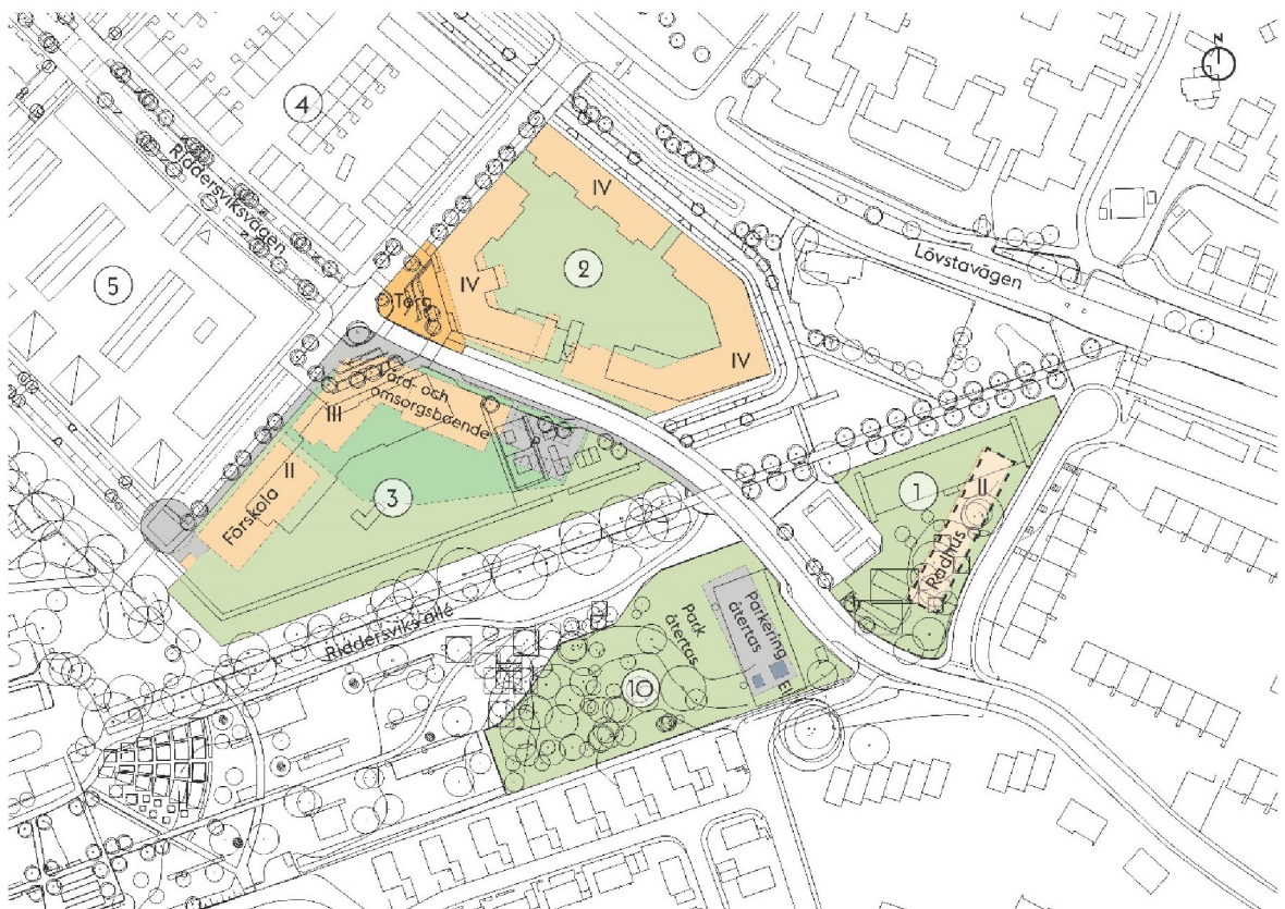
Del av situationsplan för Riddersvik, fil daterad 2019-09-17. Aktuell förskola finns i område nr 3.