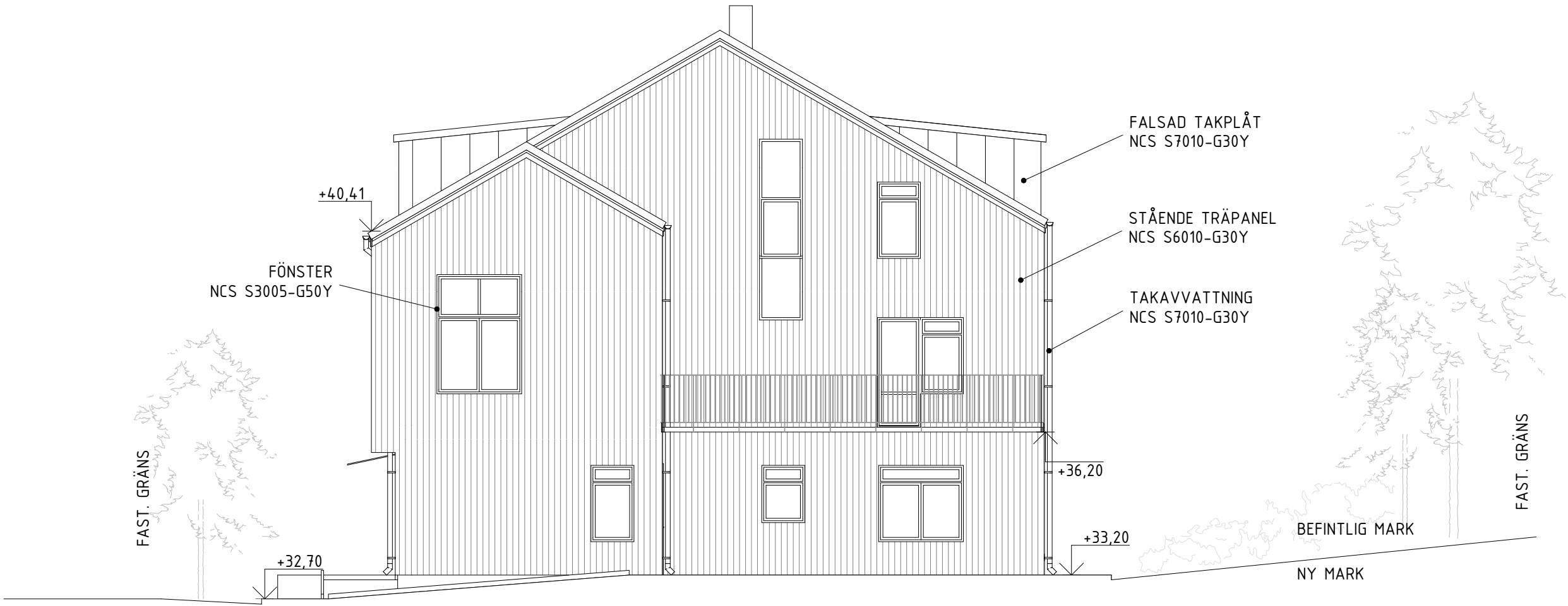
FASAD MOT NORR 1:100