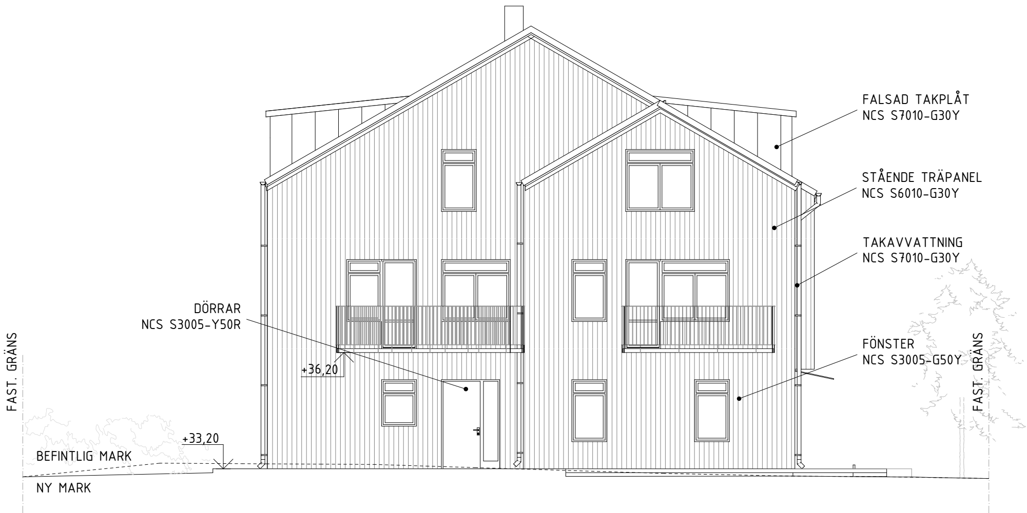
FASAD MOT SÖDER 1:100