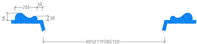
PD4 Omfattning kring rosettfönster på östra gaveln