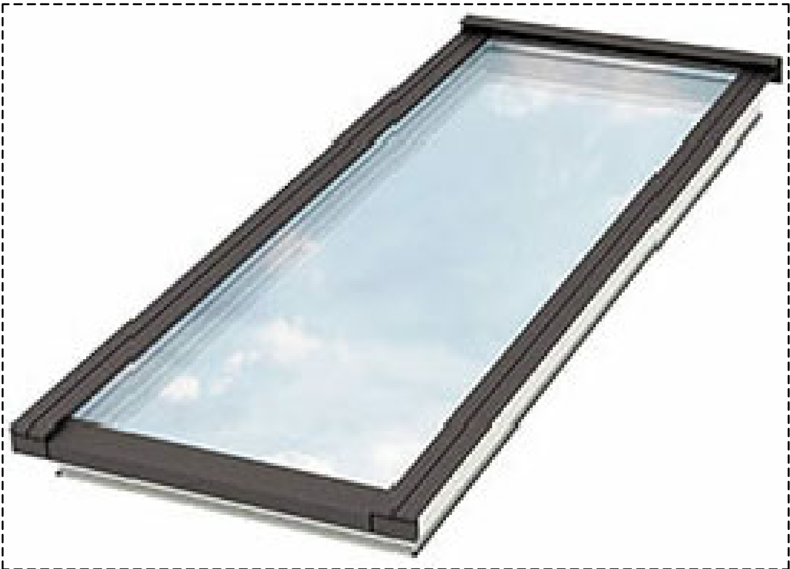
VELUX TAKLJUSMODUL "NORDLJUS"