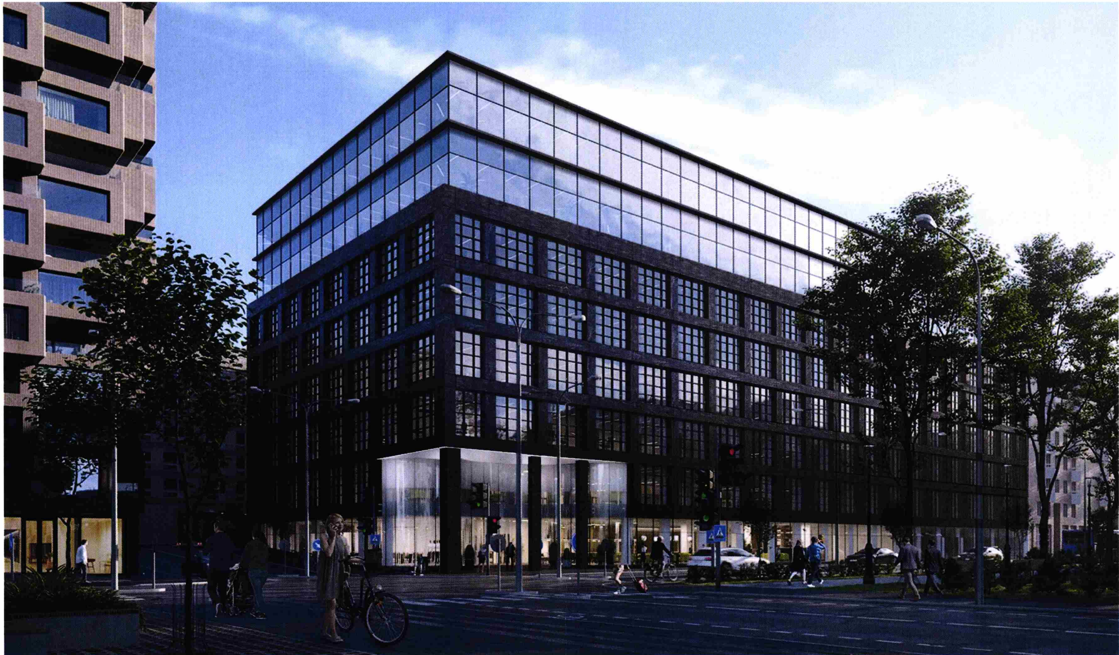
Rendering Gatuvy från norr