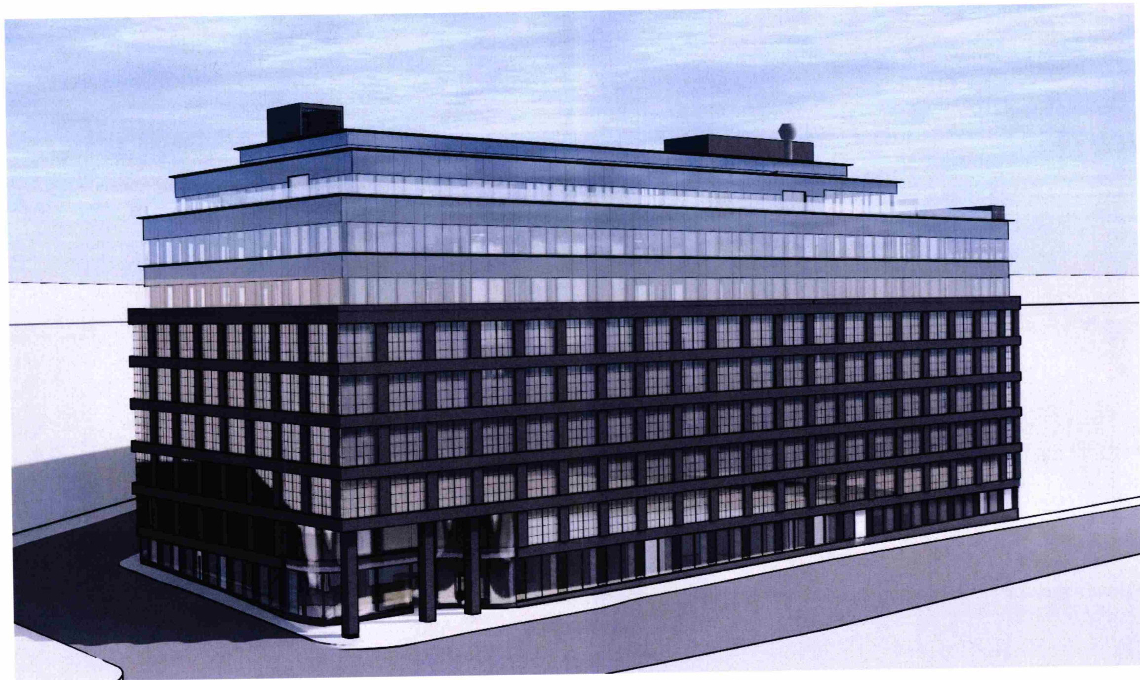
Föreslagen byggnadsutformning Flygvy från norr