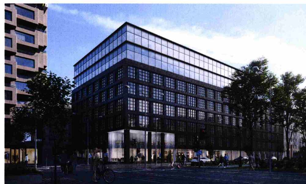
Föreslagen byggnadsutformning Gatuvy från norr