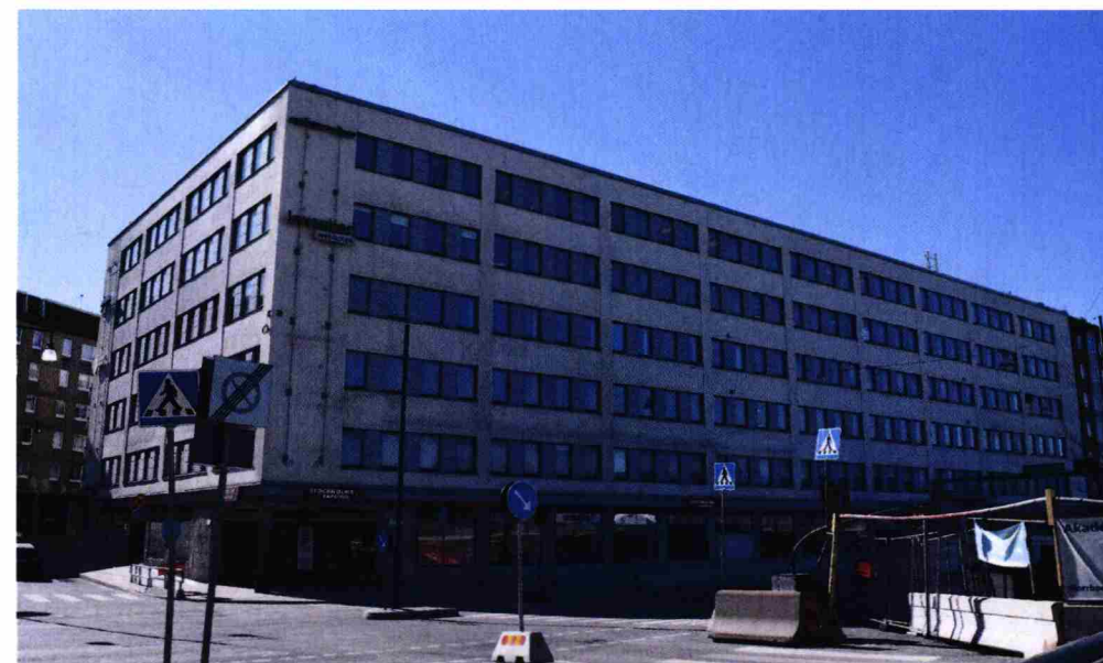
Befintlig byggnad Gatuvy från norr

Det utförs en ca 85 kvadratmeter stor ljusgård som löper ner igenom samtliga kontorsplan till entréplan och förser ytorna med bättre ljus och innefattar nya hissar och en trappa.