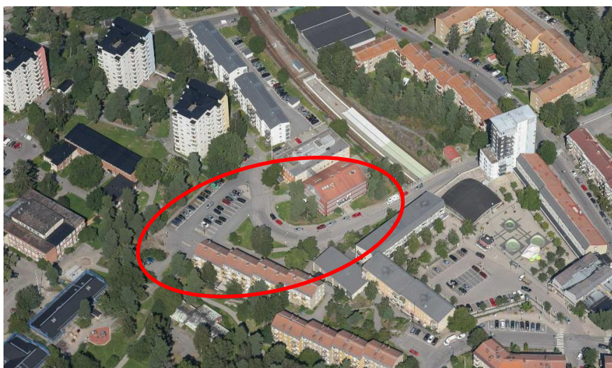
Snedbild över planområdet med omgivande bebyggelse.