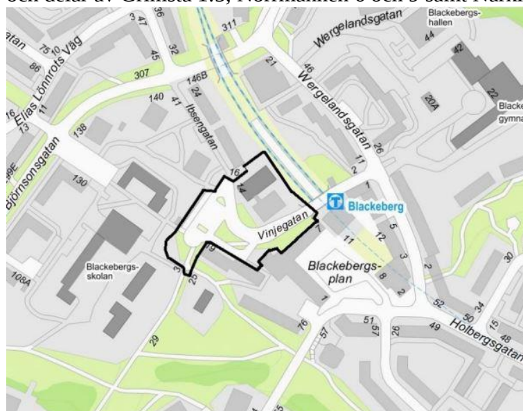
Karta som visar planområdets avgränsning.

Planområdet omfattar cirka 8500 kvm och ligger vid Vinjegatan, strax väster om Blackebergs tunnelbanestation. De fastigheter som berörs av planen är fastigheten Blackeberg 2:23, Norrmannen 11 och delar av Grimsta 1:5, Norrmannen 6 och 9 samt Närkingen 5.