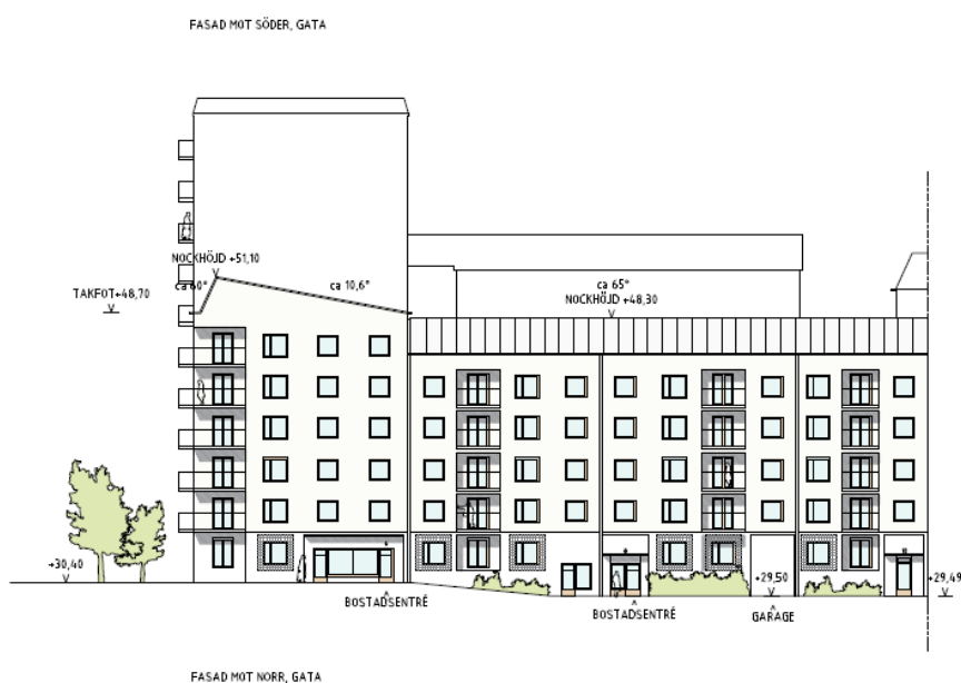
Illustrationen visar möjlig utformning av bebyggelsen mot nordväst. De delvis indragna balkongernas placering skapar fasader som delas in vertikalt. Takets utformning knyter an till bebyggelsen runt Blackebergs plan. Källa: dinelljohansson AB.