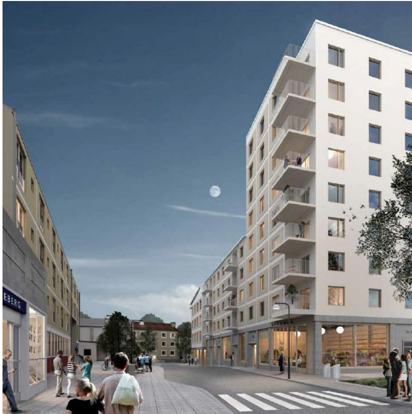
Vy från Vinjegatan utanför tunnelbanans entré. Närmast till höger syns den högsta byggnaden i förslaget.

Bilparkering för tillkommande bostäder sker i garage och som markparkering på kvartersmark. Parkeringstalet är 0,44 bilplatser och 2,5 cykelplatser per lägenhet. Det låga parkeringstalet för bilar motiveras av ett kollektivtrafiknära läge och att byggaktören förbinder sig att genomföra mobilitetsåtgärder. Bland annat avser byggaktören att se till att bil- och cykelpool ordnas, att SL-kort subventioneras och att cykelfaciliteter som pump, tvättmöjligheter och dörröppnare ordnas i cykelrum. Entré till garaget föreslås ske från norr strax söder om fastigheten Norrmannen 10.