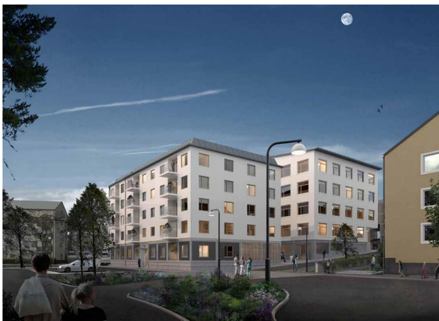
Illustration från entré vändplanen sydost om Blackebergsskolan.