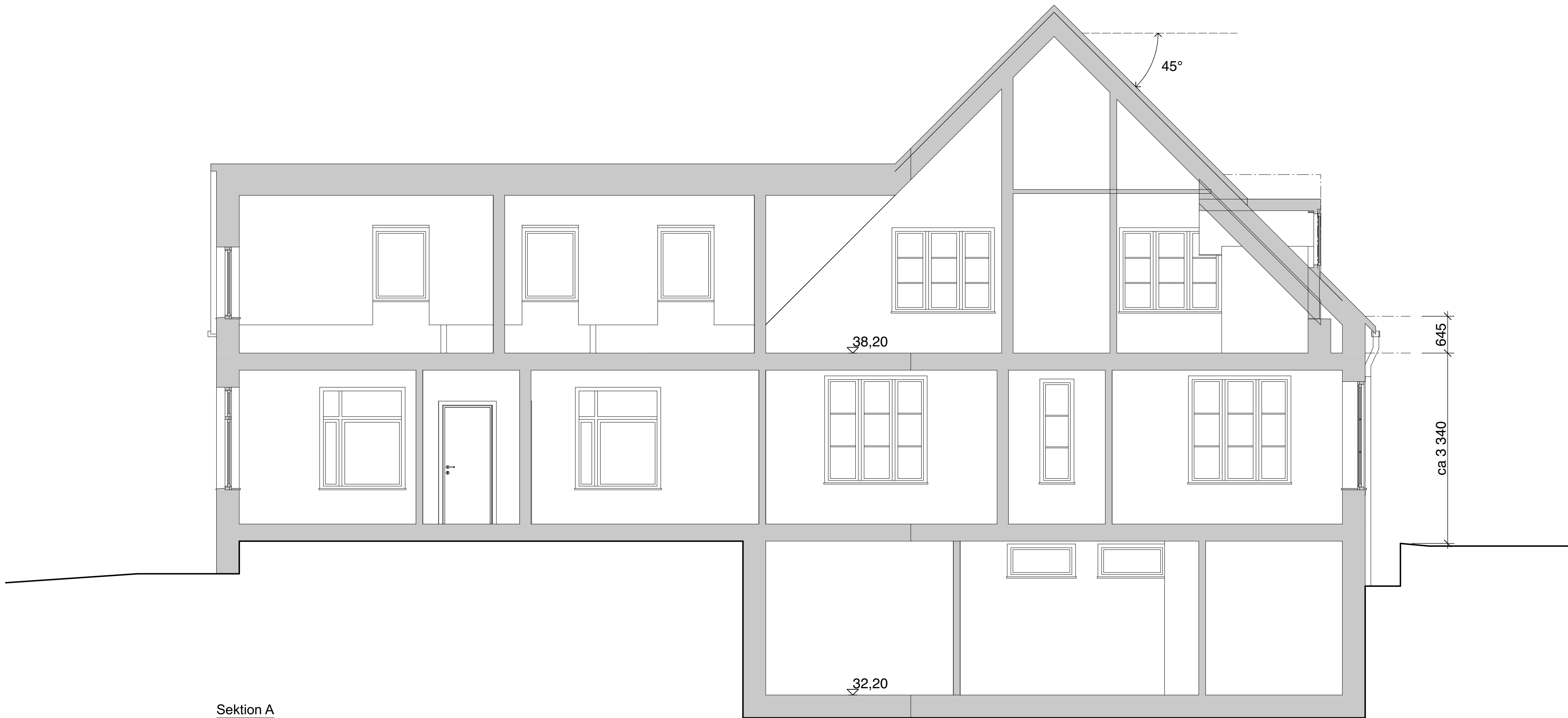
Sektion A 1:50