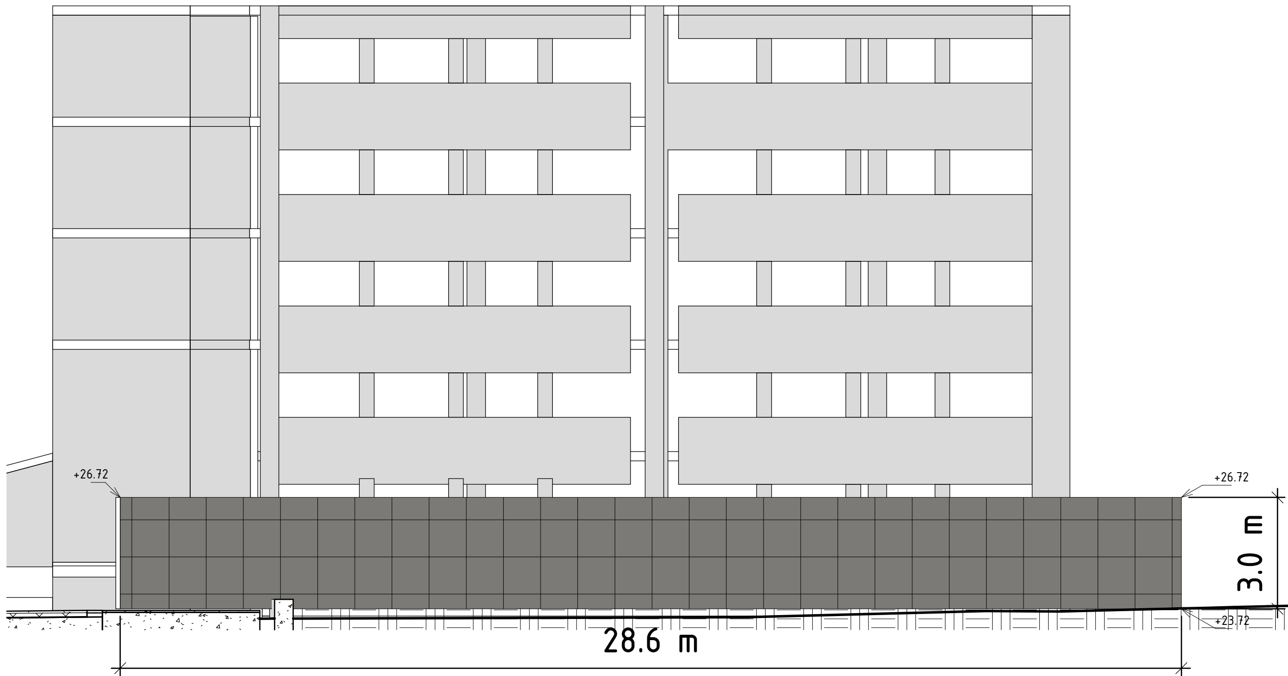
Fasaduppställning I-2 - Innergård 1 : 100