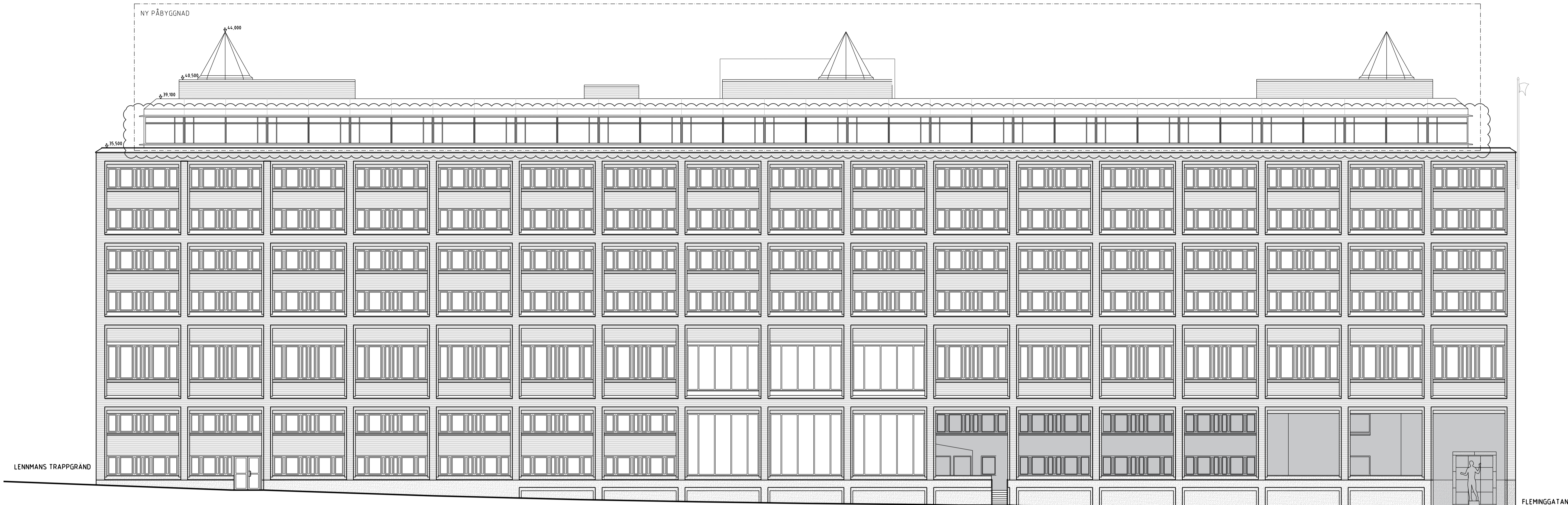
FASAD MOT VÄSTER, SCHEELEGATAN

ALLA MÅTT ANGES I MM. PLUSHÖJDER ANGES I M