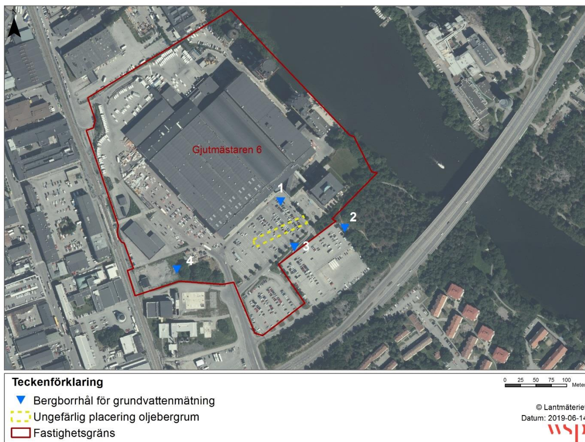
Figur 2. Placering av bergborrhål och oljebergtrum.